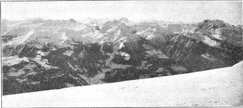
Blick in das Spitzmeilengebiet und auf die Glarnerberge.