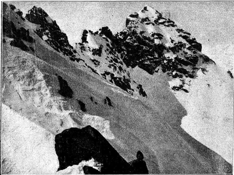
Mittelgrat und Piz Kesch.