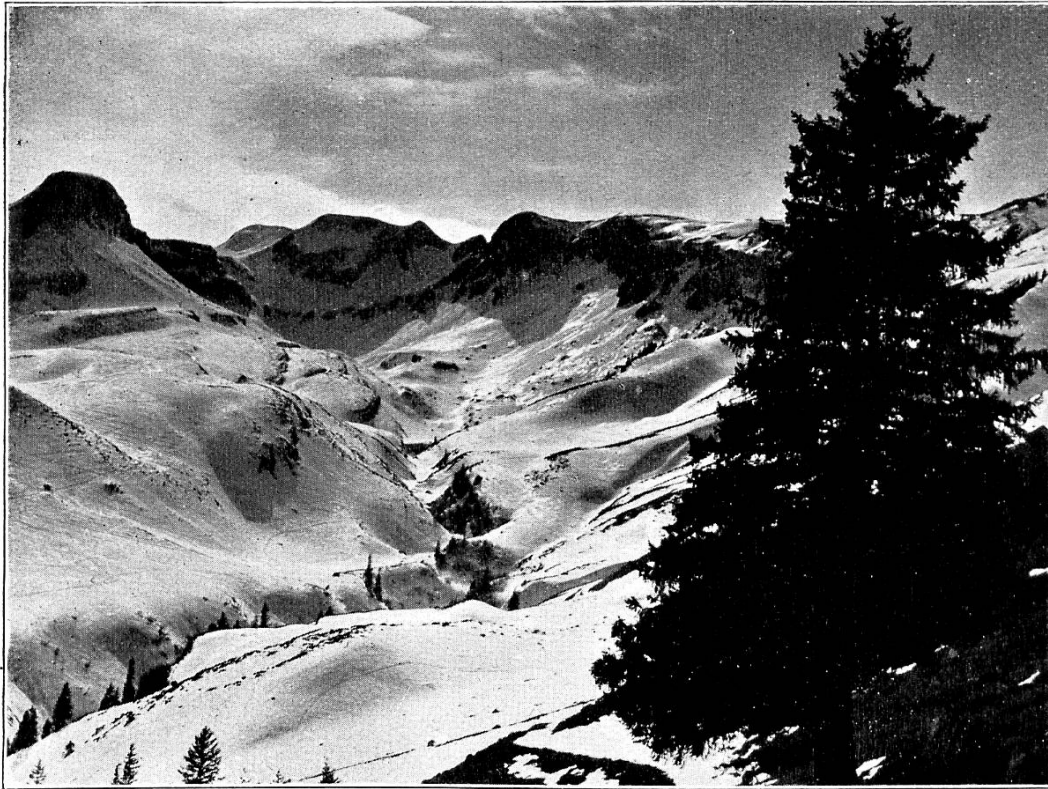
Schluchiberg und Lauchernköppli.