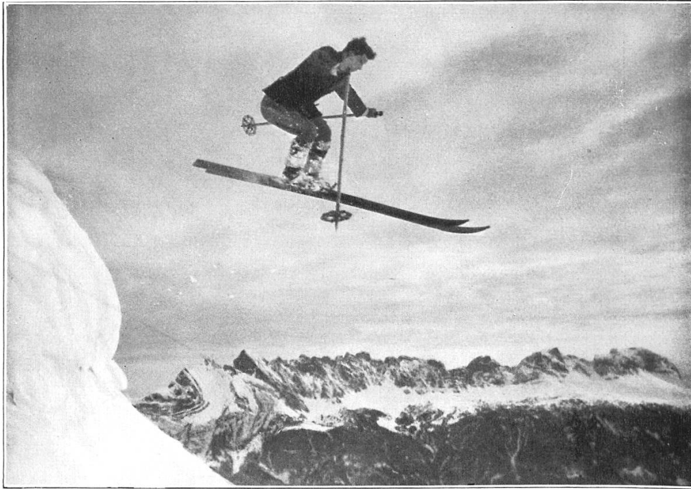
Der Alpenflieger Bärtsch.