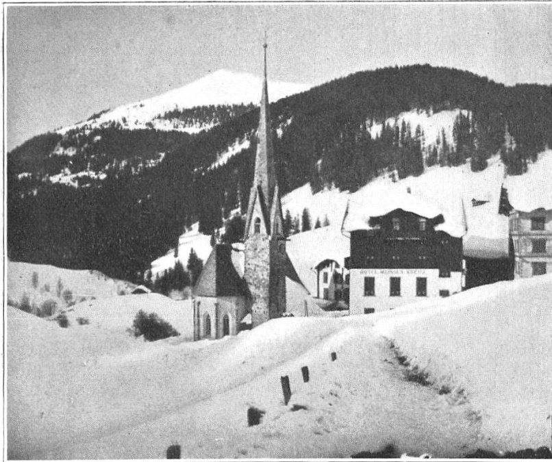
St. Antönien mit dem Kreuzgipfel.