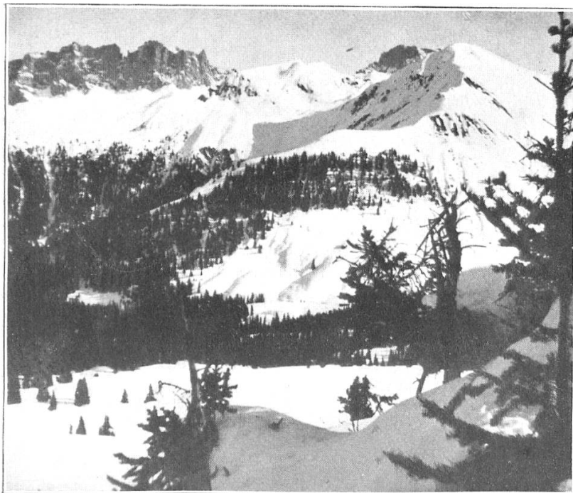
Sulzfluh und Drusenfluh.