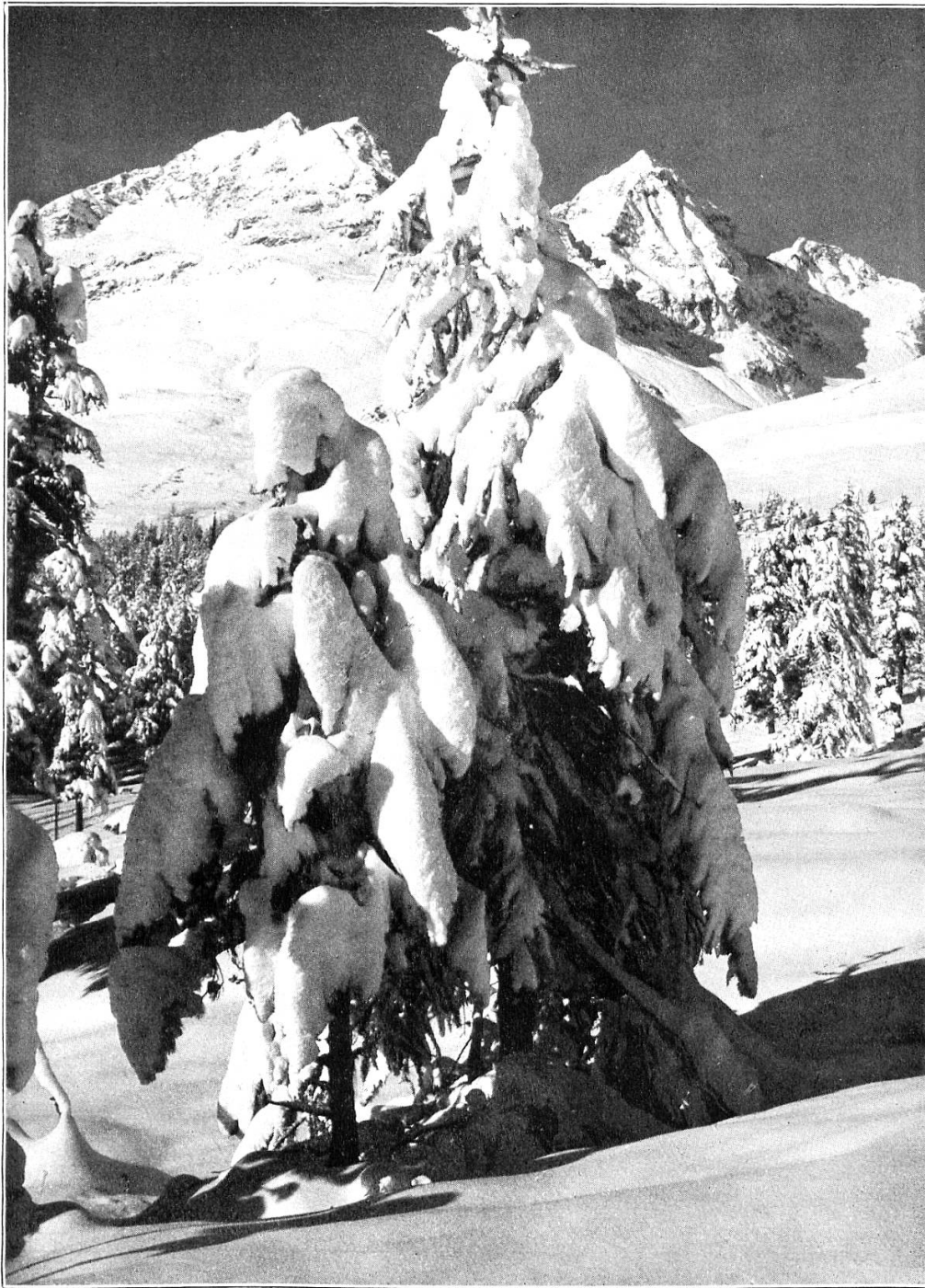
St. Moritzer Winterpracht.