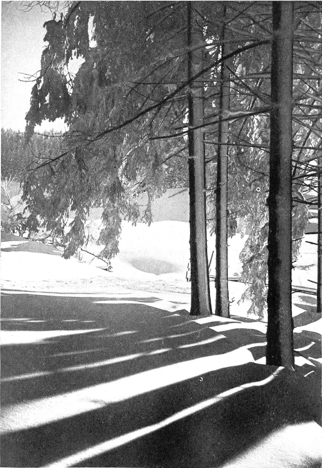
Splendeur du soleil.