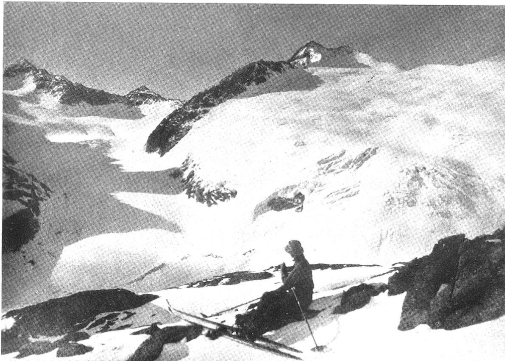
Am Kammliegg; Blick auf Hühner- u. Bächlistock (Art. Seite 91)