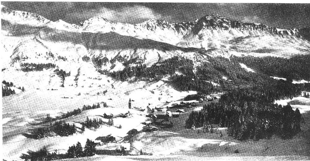
Parpan gegen Urdenfürkli