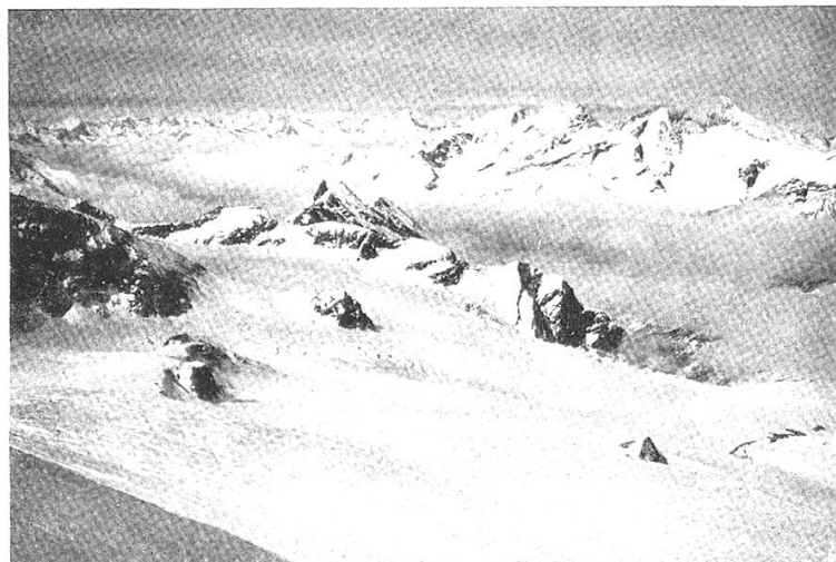
Blick von Fluchthorn gegen Britannia; J. Gaberell Egginer- und Weissmiesgruppe