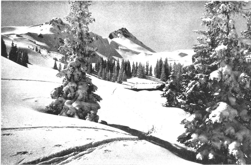
Adelboden; am Hahnenmoos-Pass mit Regenbofshorn