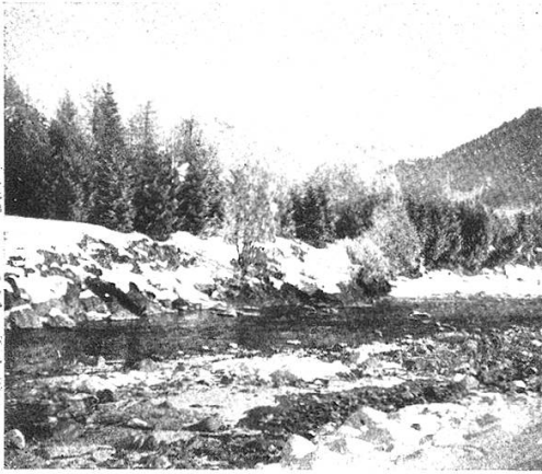
Am Hinterrhein bei Splügen