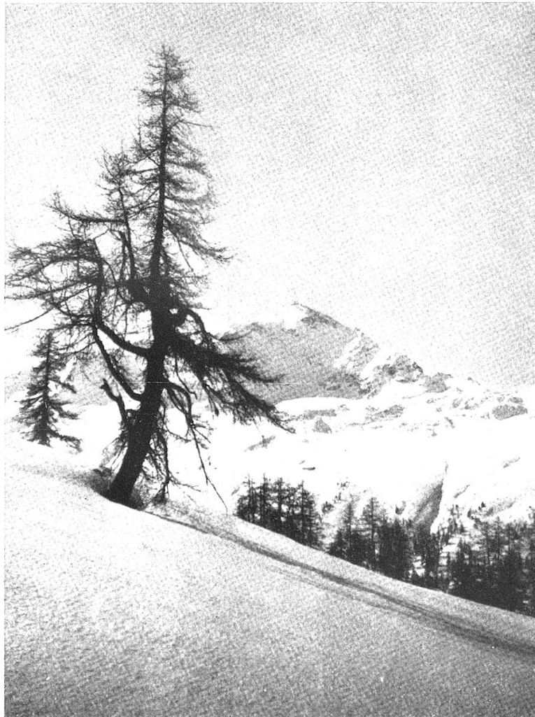
Aufstieg gegen die Surettaseen Piz Tambo mit Areuepass