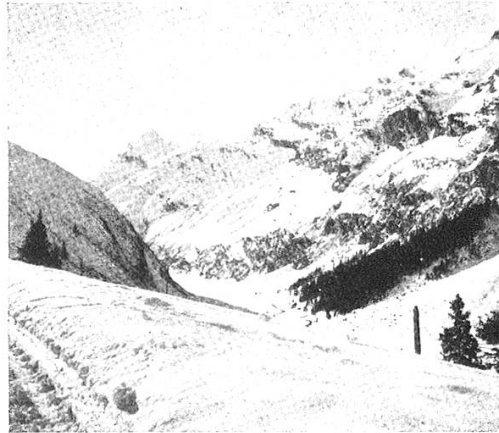
Zapporttal von der Bernardinstrasse