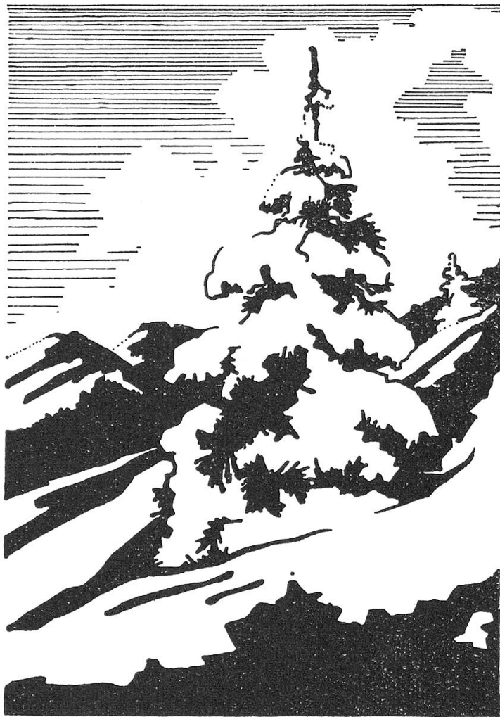
Winter im Jura