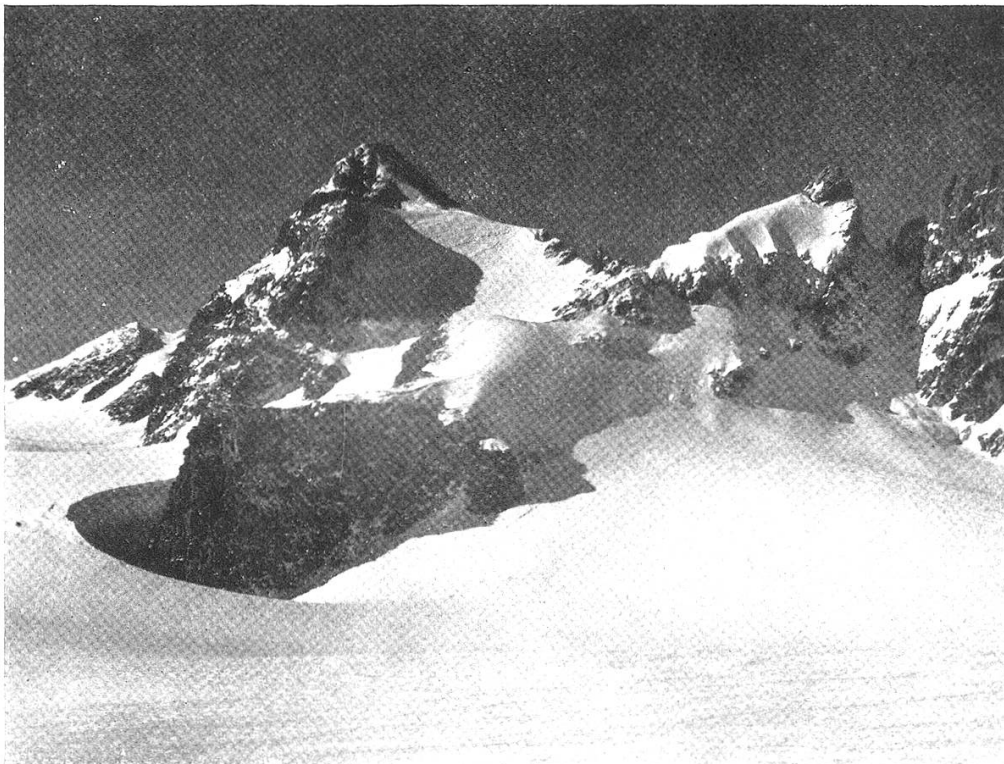
Bocktschigel von Südosten