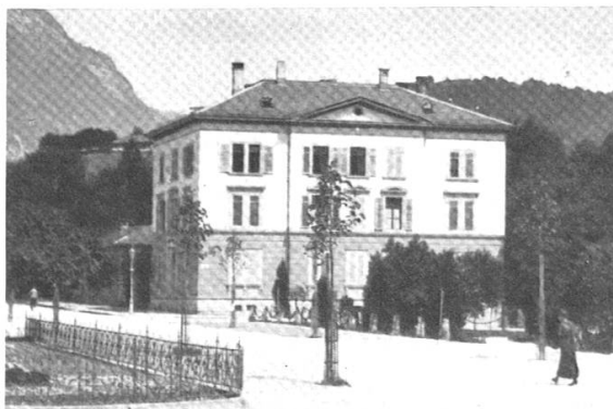
Das Norwegerhaus in Glarus