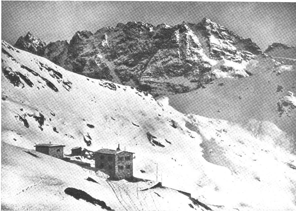
Silvrettahaus, 2344 m