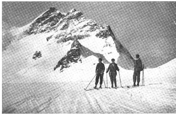
Das Skiparadies mit Jungfrau

tasterei handelt, beweist die Anlage des Sporthotels auf dem Jungfraujoch. Es mochte nicht der ur-eigentlichste Zweck gewesen sein, das Skisportgebiet an den Flanken der Jungfrau zu erschliessen, das jenes grösstangelegteste Werk der Technik, das wir kennen, erstehen