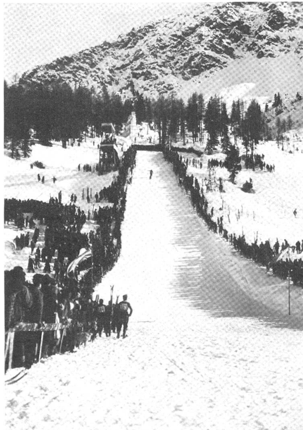
Die Bären- bad- schanze bei der Kon- kurrenz