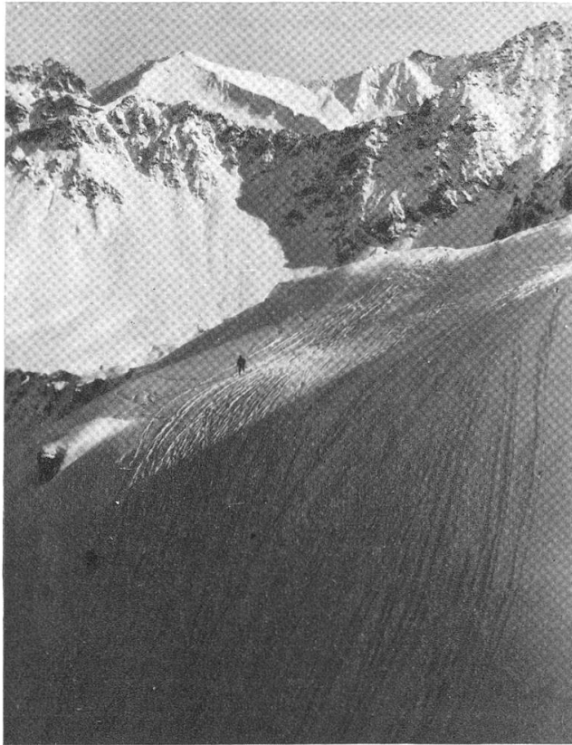
Die Preisverteilung war im Kursaal für Zivilläufer und Patrouillen auf die gleiche Zeit angesetzt worden, um einmal die ganze Skigemeinde beisammen zu haben. Auf Wunsch der militärischen Kommandostellen wurde dann aber die Preisverteilung für das Militär besonders, der anderen Preisverteilung vorausgehend, durchgeführt, jedoch im gleichen Lokal, so dass die Soldaten nachher zur anderen Preisverteilung dabei waren.

Die Organisation des Sprunglaufes bedarf zwar vieler Vorbereitung und einer grossen Anzahl Funktionäre, doch sie ist leichter als eine Lauforganisation, da die gesamte Anlage genau übersehen u. an Ort und Stelle kontrolliert werden kann. Dass dabei die Leitung auch alle kleinen Fehler selbst sieht, darf einen nicht nervös machen, sondern soll immer nur Lehre sein für ein ander Mal.