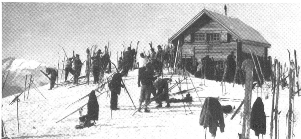
Hörnlihütte: Vor dem Start zum Abfahrtslauf