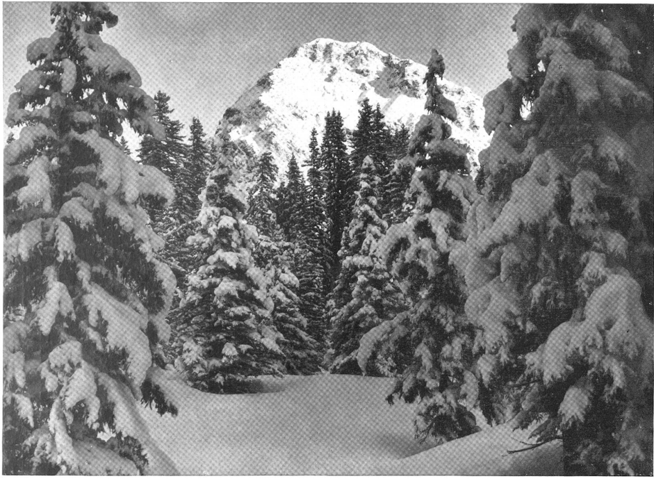
Das Aroscher Schiesshorn.