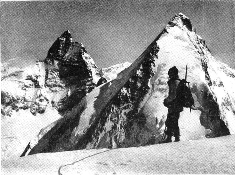
Matterhorn und Dent d'Hérens von der Tête de Valpelline. Walter Flaig