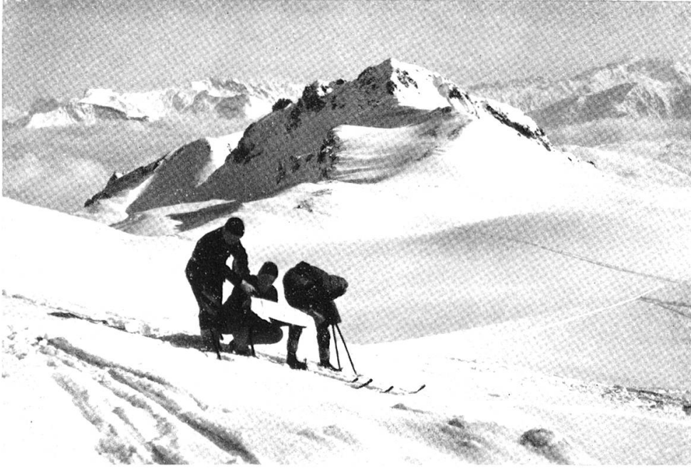
Skiläufer bei Orientierung (Parsenn)