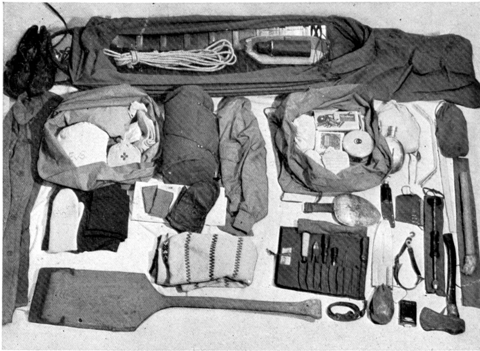
Contenu d'une „poulka“ pour une excursion prolongée

il fallait en modifier entièrement la structure, afin de réduire la résistance le plus possible... La nouvelle forme que je lui ai donnée offre les caractéristiques suivantes: le fond du véhicule est constitué par une surface plane, se relevant dans sa partie antérieure, relativement large et conservant cette largeur dans la partie relevée. De cette surface montent deux plans latéraux qui s'inclinent fortement vers l'extérieur et dont la largeur est beaucoup moindre que celle du fond. Celui-ci est bordé, sur toute sa longueur, de barres parallèles au nombre de trois, qui y sont directement fixées.