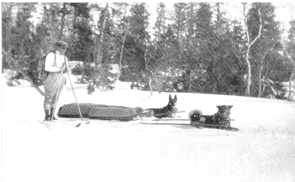
La grande mode, aujourd'hui en Suède, est de partir en ski avec sa „poulka“ et ses chiens

main, et d'arriver progressivement à saisir, de l'autre main, la remorque suffisamment près de la « poulka » pour pouvoir diriger celle-ci à côté des skis. Si l'on traverse une étendue boisée, on ramènera, en passant le long des arbres, la corde, saisira la patte d'oie, pour soulever un peu l'avant de la « poulka », ce qui permettra de la diriger aisément et rapidement. On peut même, dans les passages difficiles, saisir l'arc avant du traîneau et laisser celui-ci traîner sur sa partie arrière... La seule difficulté réelle provient de ce qu'on n'a qu'une seule main libre. Il faudra donc renoncer à freiner avec les bâtons, ce qui, d'ailleurs, beaucoup trop souvent, n'est qu'une mauvaise habitude.