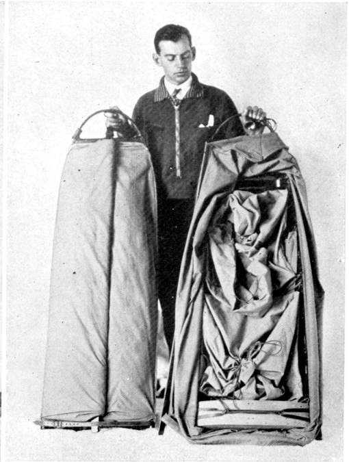
Cette photo montre la bâche qui permet de protéger hermétiquement le contenu de la „poulka“ en cas de tourmente de neige