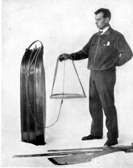
„Poulka“ avec traits et harnais