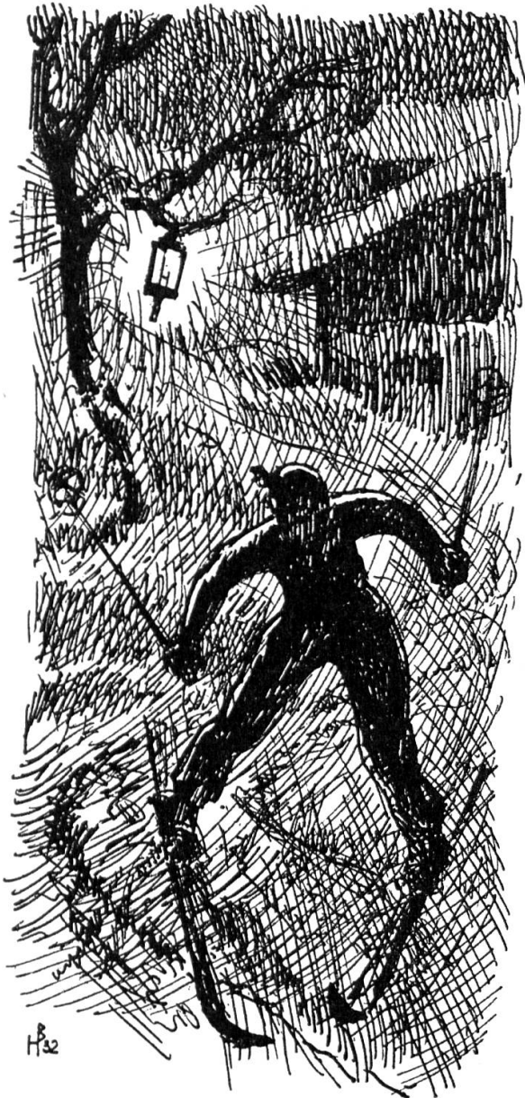
Mit Ski und Laterne hinterm Haus Zeichnung von Björn Hansen

könnten sie schlechthin ihr Herz hängen, als ob es nicht noch andere liebenswerte Dinge zwischen Himmel und Erde gäbe, als 2 solcher Bretter mit hochgestellter Schnauze. Das sind Menschen mit einem Skikomplex. In irgend einer Form vielleicht krankhaft, aber diesmal gesund-krankhaft.