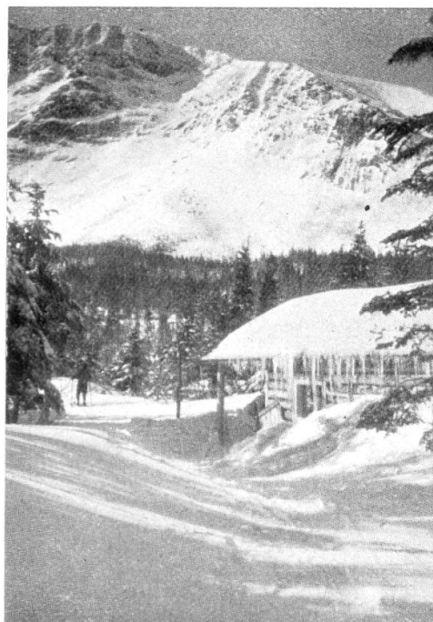
Le Mt. Katahdin (Maine), vue de Chimney Pond