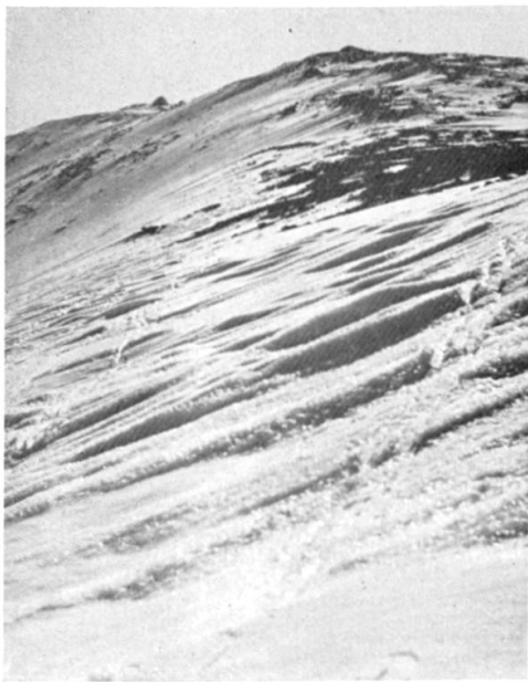
Sommet du Mt. Washington, 6290 feet