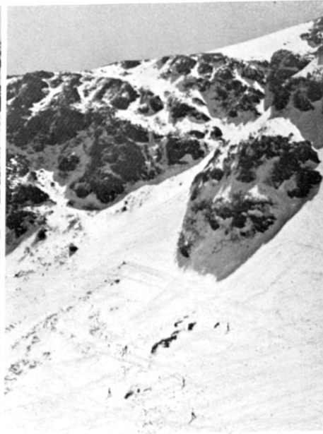
Tuckermans Ravine du Mt. Washington