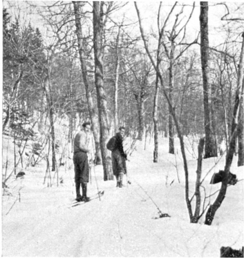
Dans les bois de Wilmington (Vermont)