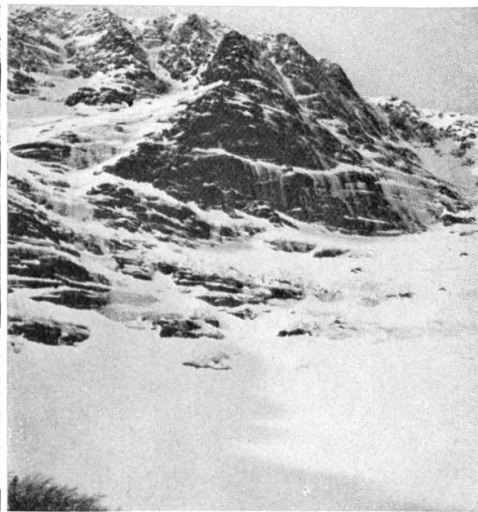
Le Sodkar (South Basin) du Mt. Katahdin

aux portes de la ville. Mais le vrai skieur préfère la région où sont blottis les hameaux de Mont Rolland, Sainte Marguerite, Ste. Agathe et St. Jovite. La neige y est généralement assez épaisse pour couvrir les sous-bois et rendre fort plaisant le ski en forêt. Les collines y sont basses et ondulées. Comme on peut s'y attendre pour une pénéplaine érodée, il n'y a ni sommets saillants ni longues excursions comme de l'autre côté de la frontière, mais il y a de quoi permettre de l'excursions les plus variées et les plus plaisantes. Une région très pareille se retrouve dans le bouclier Laurentien au nord du Labrador mais on n'y peut aller que là où le chemin de fer s'est introduit. A Québec on peut faire du ski sur les collines au nord de la ville et un voyage jusqu'à Point à Pic (Baie de Murray), point terminus de la ligne, vaut à qui s'y rend plus d'une belle course. Nulle part cependant les montagnes ne dépassent 700 m. et les forêts sont terriblement denses. On pourrait prolonger indéfiniment la liste des possibilités mais elles ne sont jamais plus «satisfaisantes», car sauf pour quelques très rares centres, les skis ne sont qu'un moyen de se transporter qui remplace les raquettes où les attelages de chiens. Et puis on ne peut pas songer au développement d'un sport dans un pays où il faut transporter avec soi sa couche et sa nourriture, et où il s'agit d'arriver à l'étape avant que les provisions ne soient épuisées.