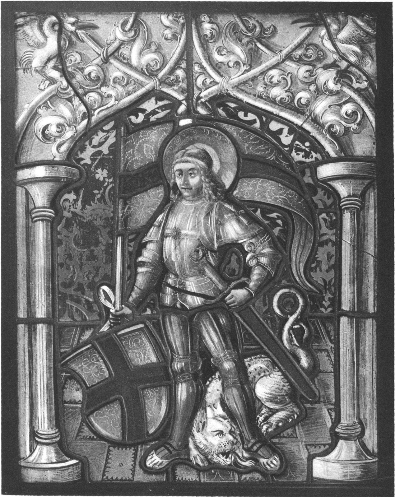
Figurenscheibe mit Darstellung des hl. Georg Arbeit des Zürcher Glasmalers Lukas Zeiner. Um 1510.