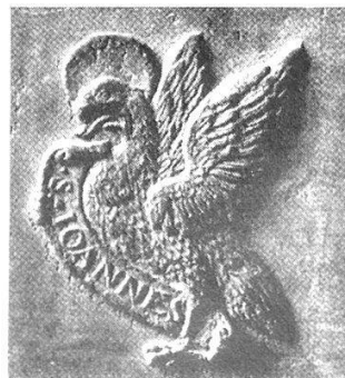
Abb. 22 a. Details der grossen Glocke von Knonau. Giesserinschrift, Akanthusfries unter dem Spruch auf dem Glockenhals und die vier Evangelistensymbole samt den Wappens von Zürich und Knonau.