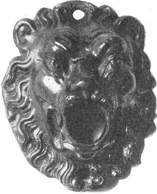
Abb. 25. Bronzene Löwenmaske vom Brunnen an der Südseite des ehem. Oetenbachtöres in Zürich. Vermutlich aus der Füsslischen Giesserei stammend. 17. Jahrh.

auf der Mörserleibung, 43) sodann eine Brunnenröhre mit Mündung in Form eines Delphins samt zugehöriger Löwenmaske und halbkreisförmigem, eisengeschmiedetem Röhrenhalter vom Brunnen an der Südseite des ehemaligen Oetenbachtöres in Zürich. 44)