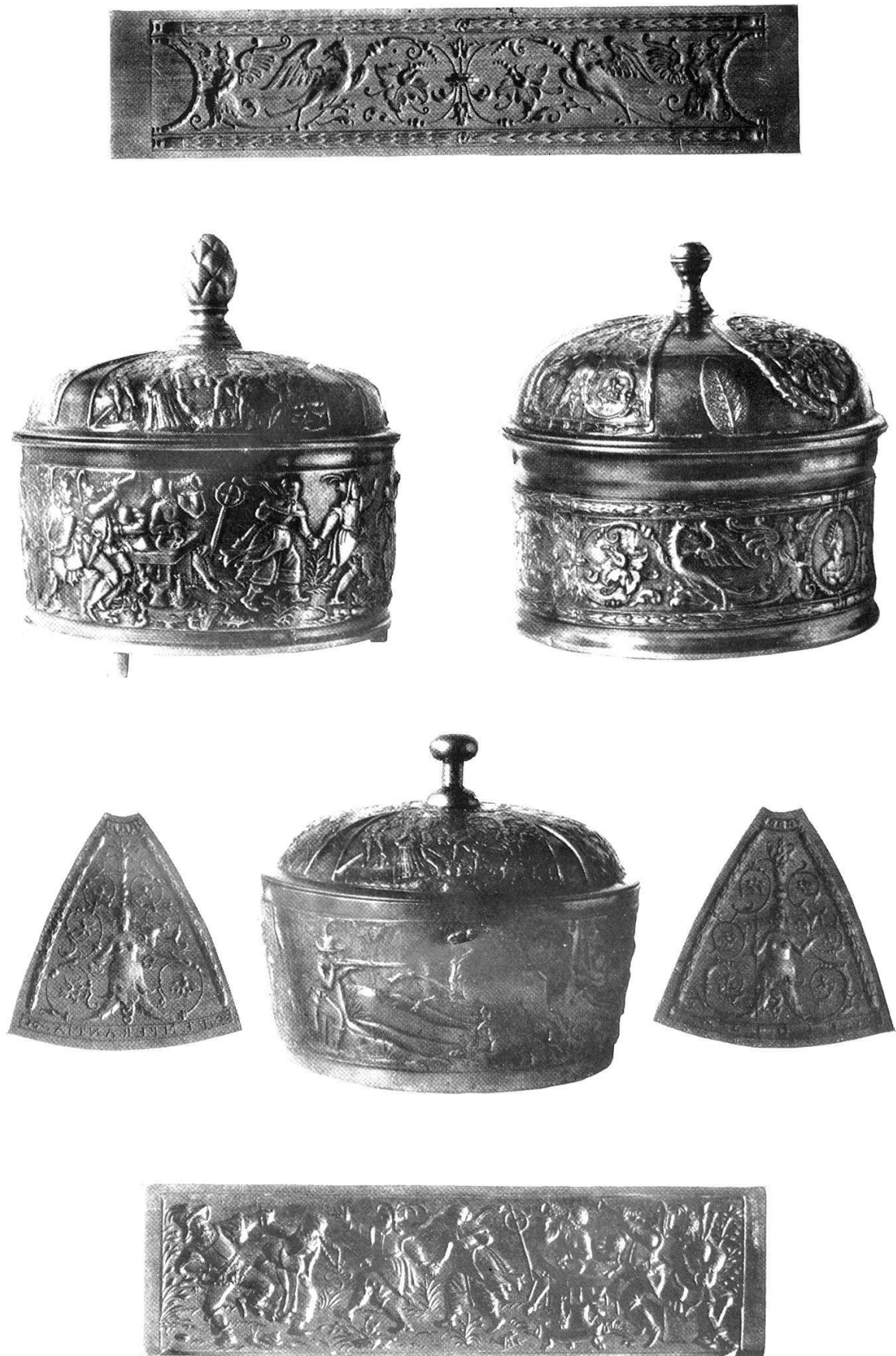
Abb. 26. Spanischsuppenschüsseln mit zugehörigen hölzernen Gussmodellen aus der Füsslichen Giesserei in Zürich.