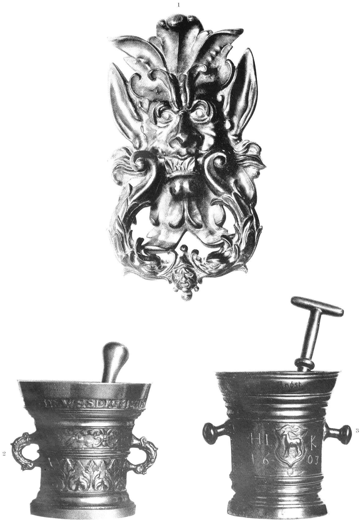
Abb. 24. Werke aus der Füsslichen Giesserei in Zürich: