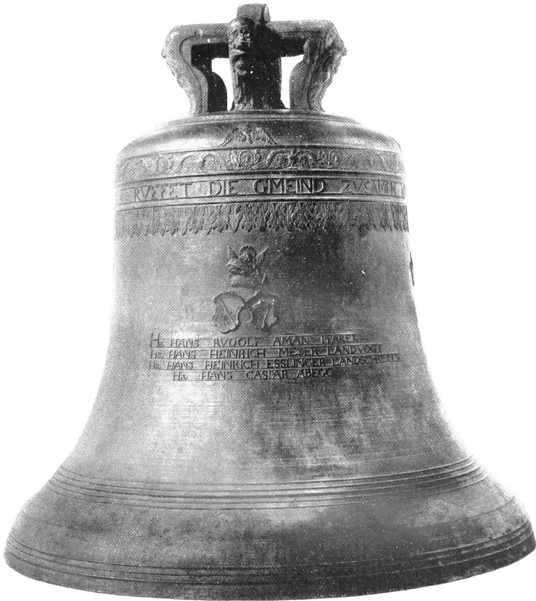
Abb. 22. Grosse Glocke aus der Kirche von Knonau. Gegossen von Heinrich I. Füssli in Zürich 1666.