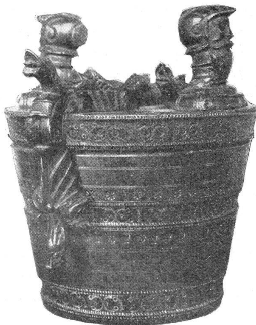
Abb. 27. Bronzener Gewichtssatz mit dem Eichstempel von Zürich und den Initialen H F. 17. Jahrh.