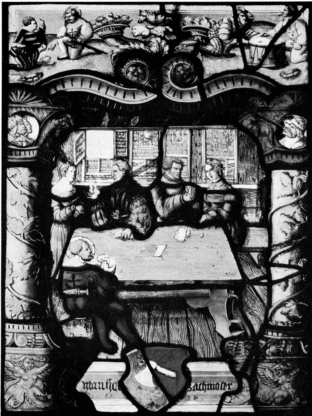
Figurenscheibe mit Wappen Bachmoser, 1538 Signierte Arbeit des Berner Glasmalers Hans Funk, gest. 1539