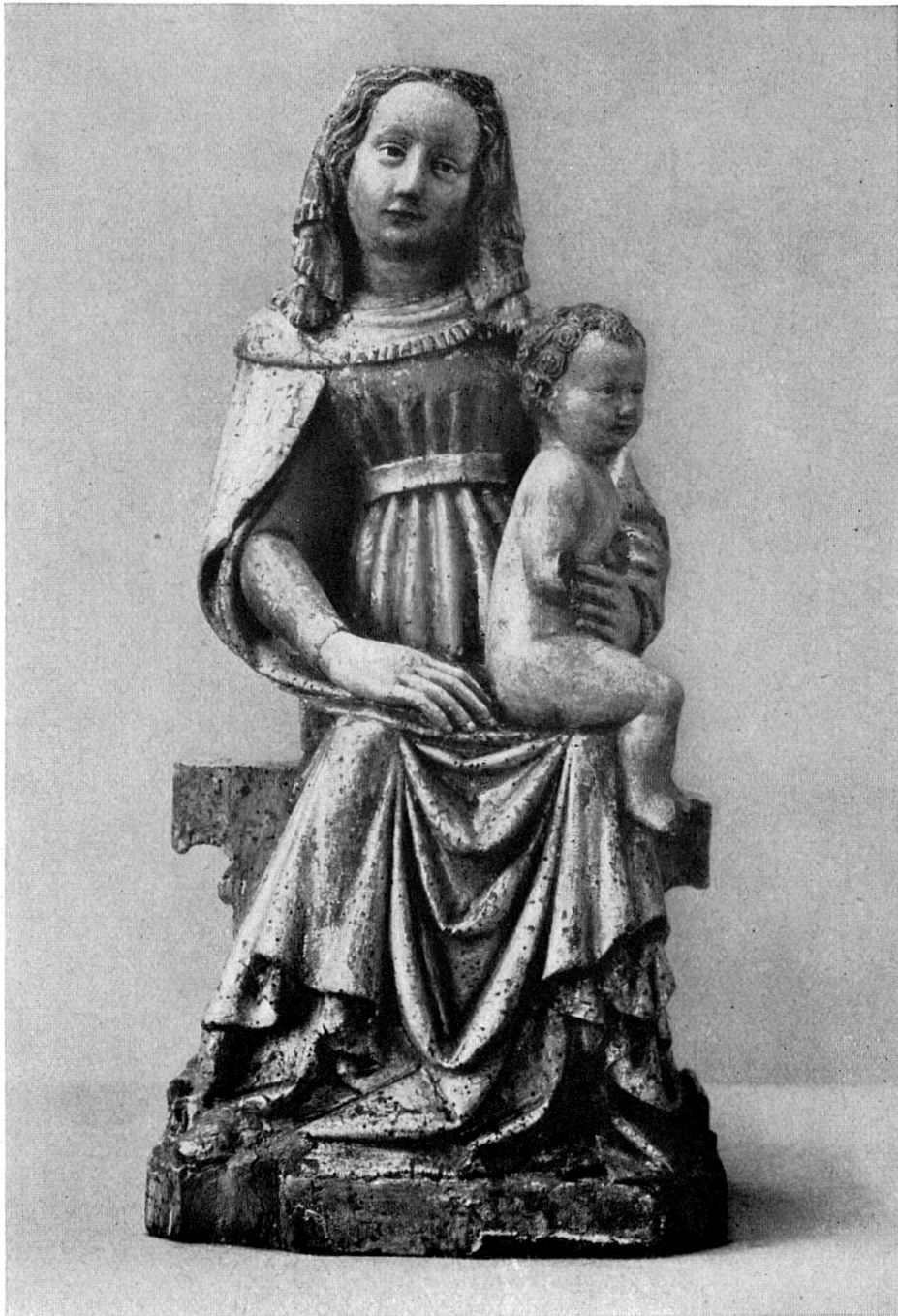
Muttergottes aus der Innerschweiz, Lindenholz, 15. Jh. Anfang