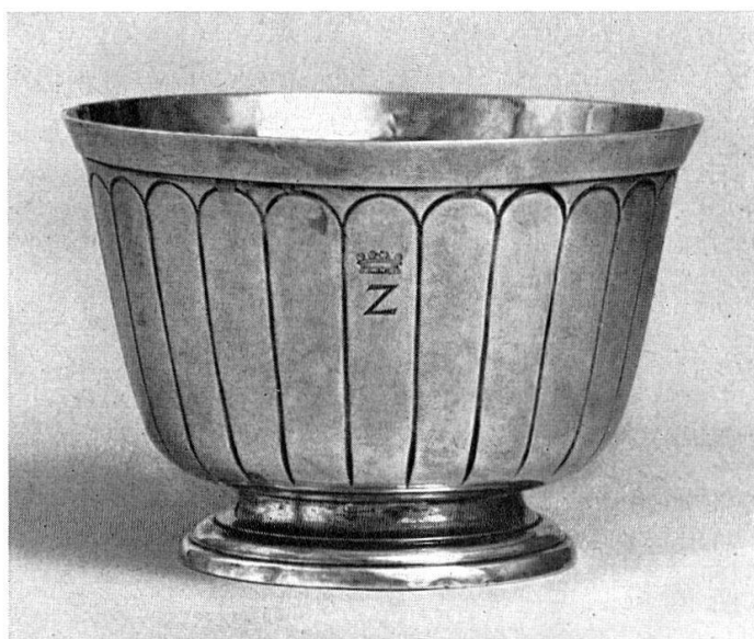
Abb. 17. Schale, Silber, innen vergoldet von Meister BG zu Genf, 18. Jh. Ende. (S. 22)

Mutschnengia, kath. Kapelle: 1 Originalplan, Grundriß 1:100. TAD