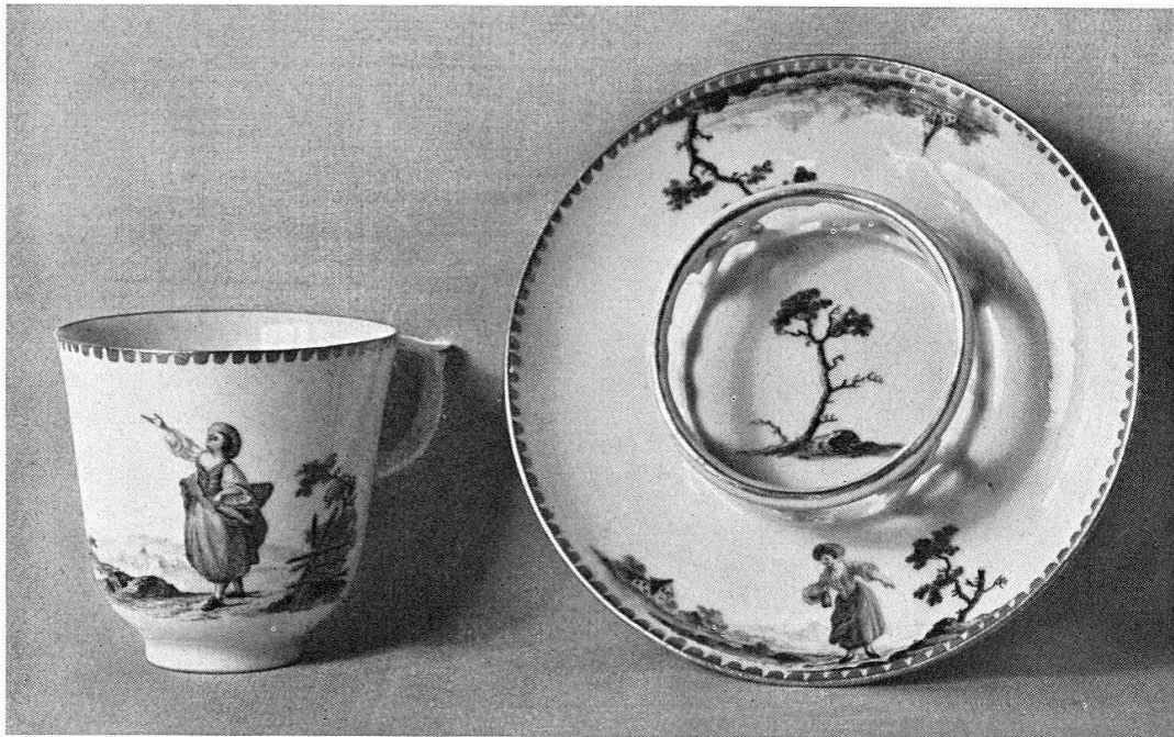
Abb. 16. Tasse mit Untertasse, Zürcher Porzellan, bunt bemalt, um 1770/80. (S. 19)

sowie Wappenstein im Konventflügel 1:1. TAD do. kath. Pfarrkirche: 2 Originalpläne, Grundriß und Schnitt 1:100. TAD do. Kapelle St. Placidus: 1 Originalplan, Grundriß 1:100. TAD Sta. Doménica, Pfarrkirche: 2 Aufnahmeskizzen, 4 Originalpläne, Grundriß und Schnitt 1:100. TAD