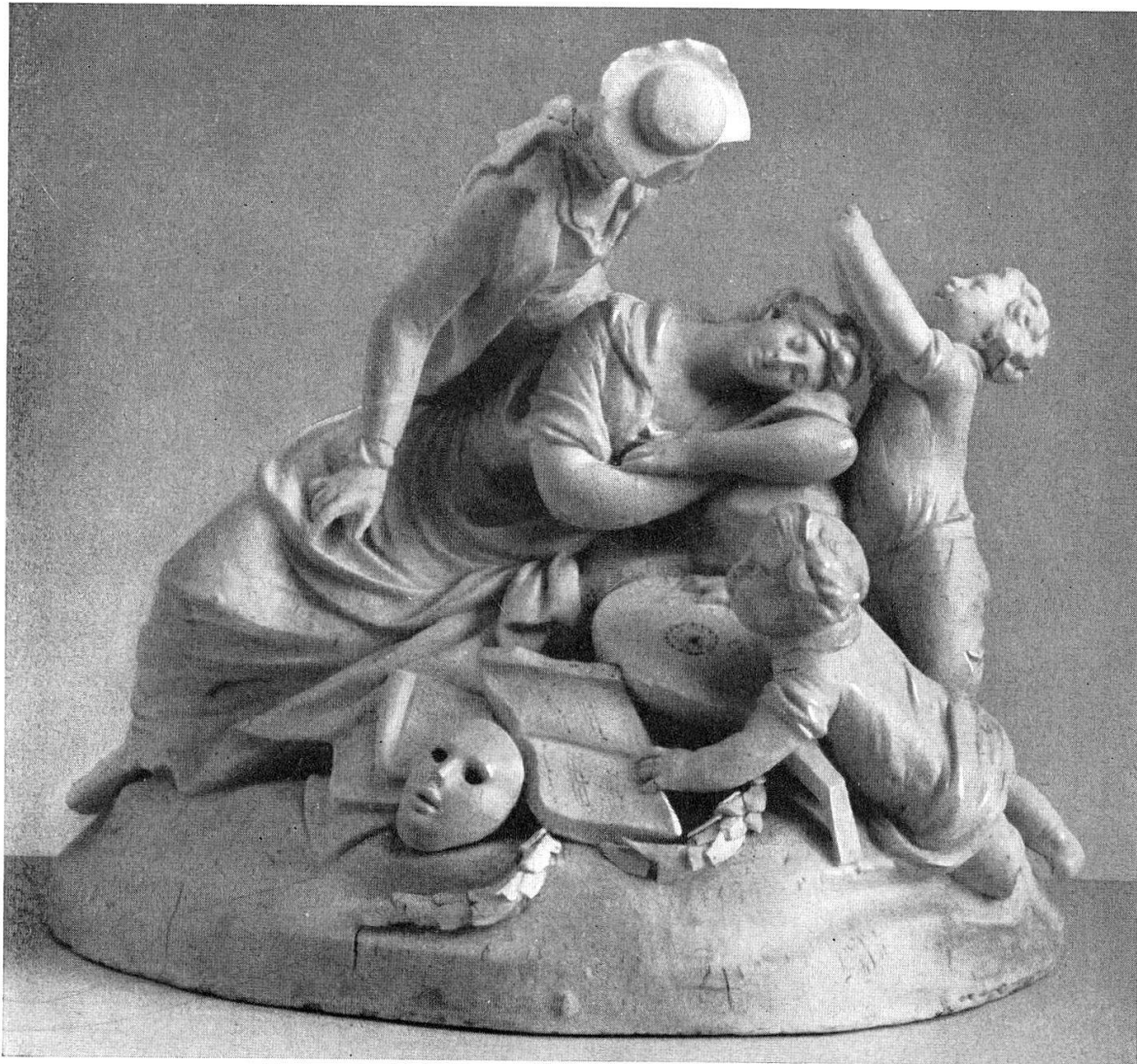
Abb. 15. Liebespaar, Zürcher Biscuit-Gruppe, um 1770/80. (S. 19)

Avers-Cresta, reform. Kirche: 5 Aufnahmeskizzen, 3 Originalpläne, Grundriß, Detail 1:100/20; 2 Ansichtskarten. TAD