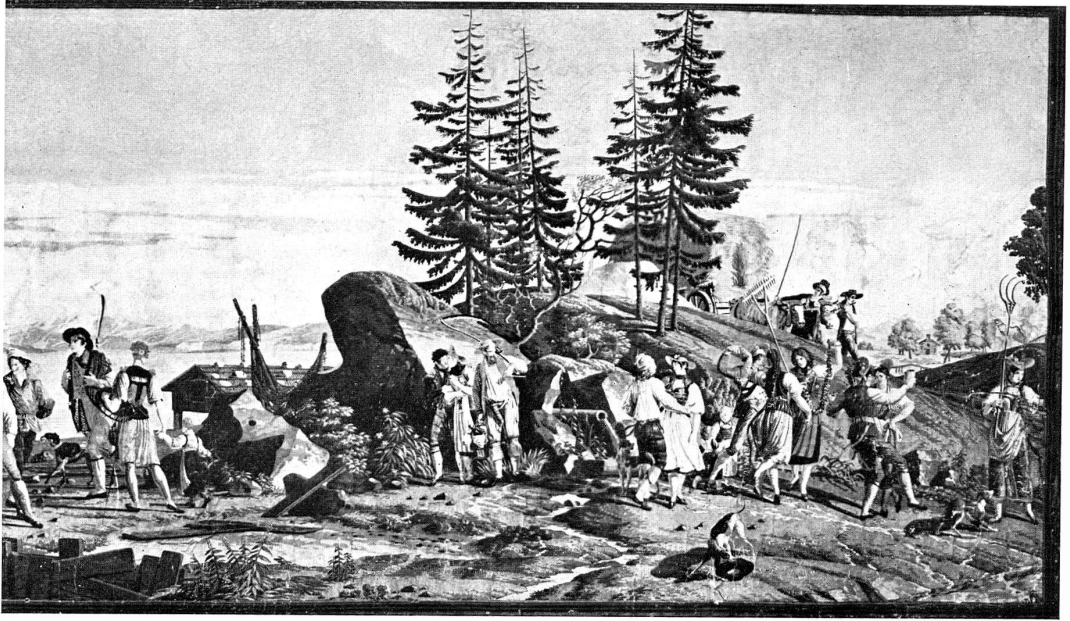
Abb. 19. Teilstück einer gedruckten Papiertapete, Elsässer Fabrikat, aus Zürich, 19. Jh. Anfang. (S. 20)