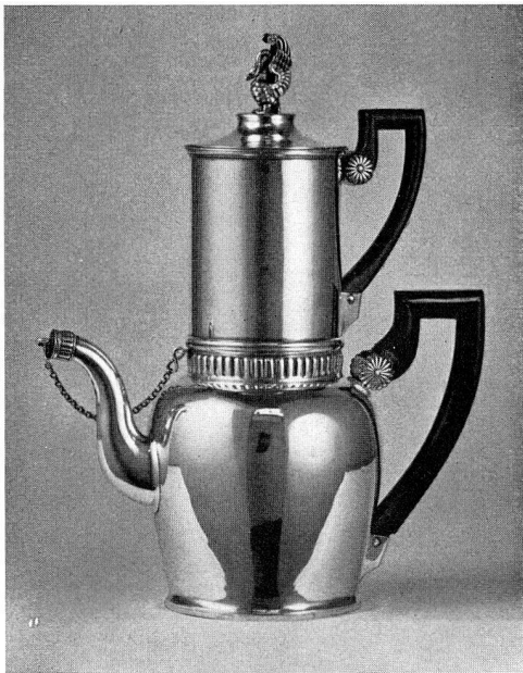
Abb. 26. Kaffeemaschine, Silber, von G.A. Rehfues, dat. 1824 (S. 19)

Astano-La Costa , Trezzini- und andere Häuser: 5 Photographien, Aussenansichten.