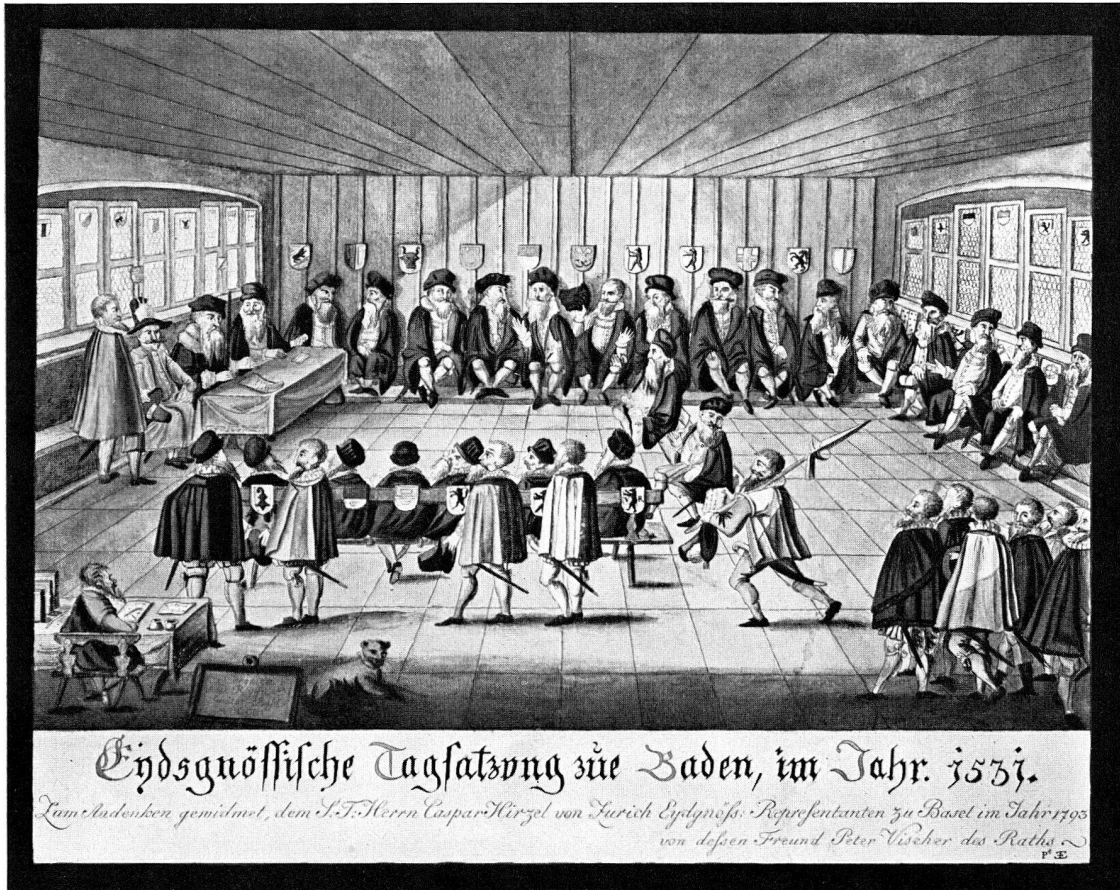
Abb. 25. Tagsatzung in Baden, von Peter Vischer, 1794 (S. 11)

Zerne, Kapelle S. Sebastian, Restaurierung 1950: 2 Photographien, Innenansichten vor und nach der Restaurierung.