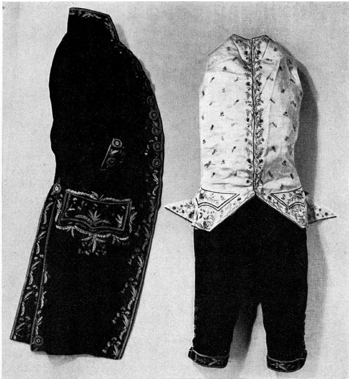
Abb. 44. Herrenkleid, aus Zürich, um 1770 (S. 44)

1955. Einzelwerke 256 Bände, 236 Broschüren; Zeitschriften 606 Bände, insgesamt 1098 Einheiten. Nach der Erwerbsart: Kauf 175, Geschenk 238, Tausch 685.