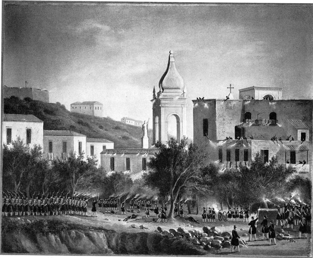
Abb. 45. Szene aus der Eroberung von Messina durch Schweizerregimenter, 1848, Öl auf Leinwand (S. 36)