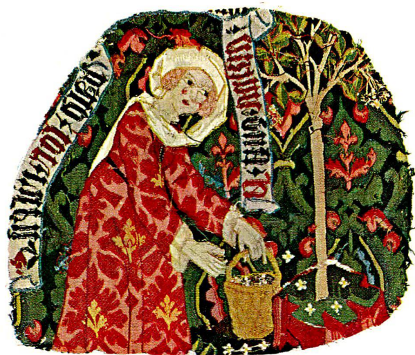
Abb. 1. Wildleutepaar im Gespräch. Frau, die Holunderblüten aufliest. Zwei Fragmente von verschiedenen Wollwirkereien. Basel (Oberrhein), um 1470. Oben: Vorderseiten. Unten: die farblich besser erhaltenen Rückseiten (S. 18)