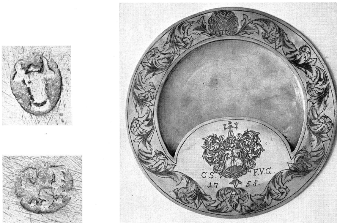
Abb. 17. Silberner Teller eines Klingelbeutels. Beschau Altdorf, Kt. Uri, und Meistermarke «CFS». 1755 (S. 42)