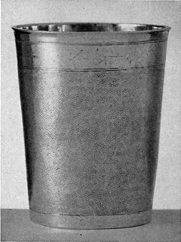
Abb. 14. Silberverguldeter Becher. Zürich. Meistermarke «DM». Um 1650 (S. 42)