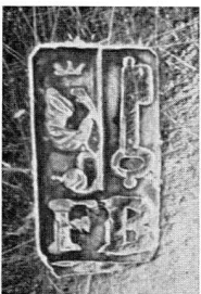
Abb. 16. Silberne «Ecuelle». Genf. Meistermarke «FB» (S. 42)