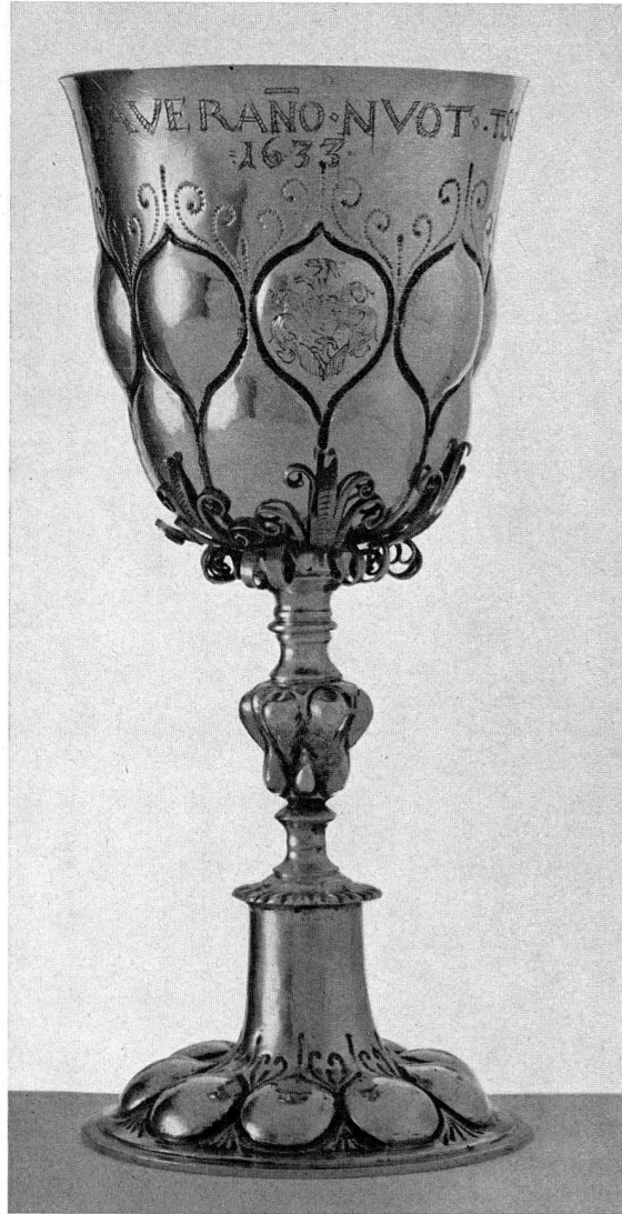
Abb. 15. Silberverguldeter Pokal. Zürich. 1633 (S. 42)