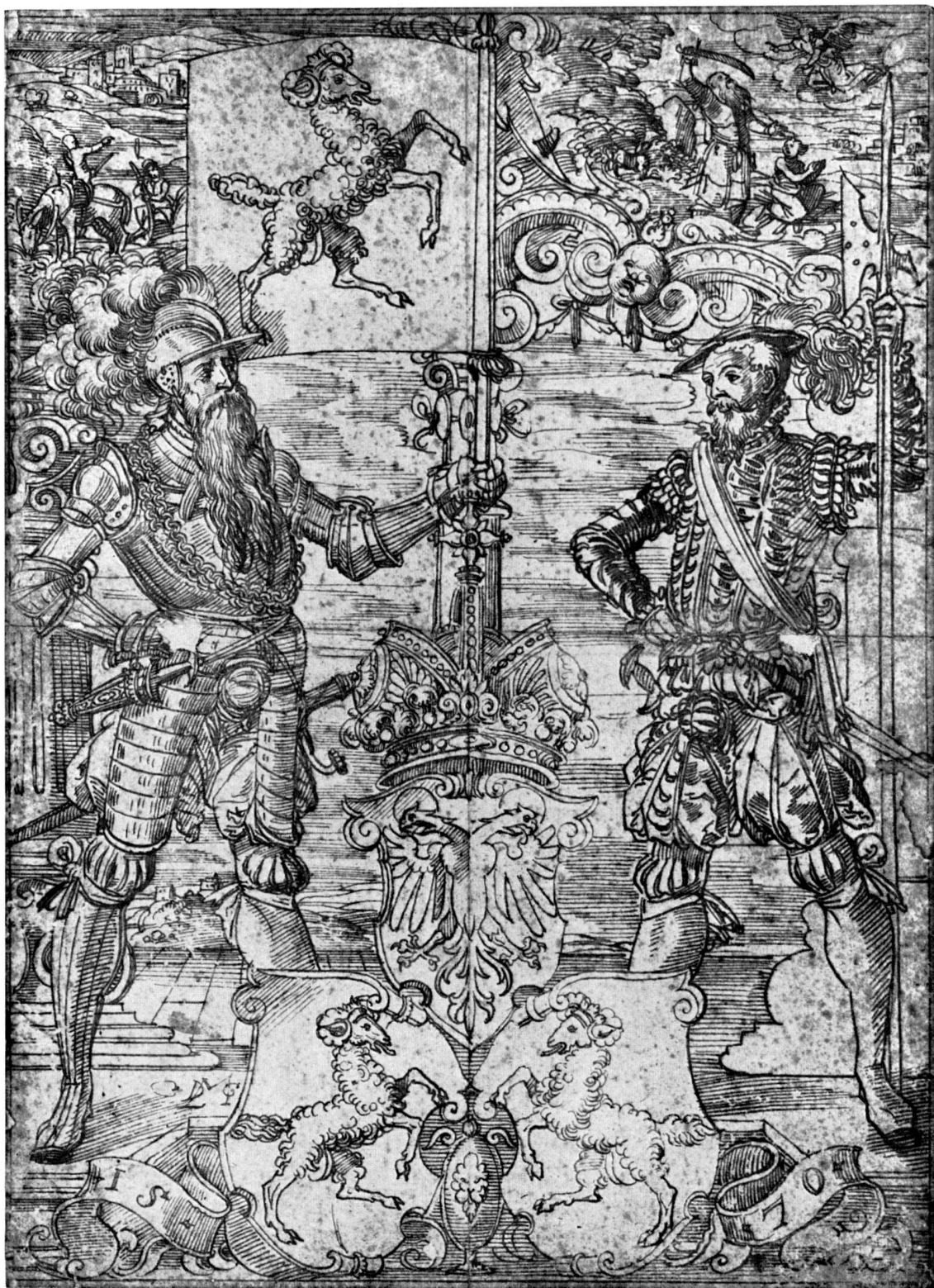
Abb. 20. Federzeichnung, Riss für eine Standesscheibe von Schaffhausen. Daniel Lindtmayer. 1570 (S. 43)