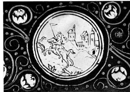
Abb. 47. Armbrustkolben mit Draht- und Perlmuttereinlage, worauf Initialen I W (S. 64)