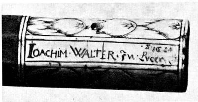
Abb. 46. Verbeinte Mündung mit Namenszug des Schäfters (S. 62)