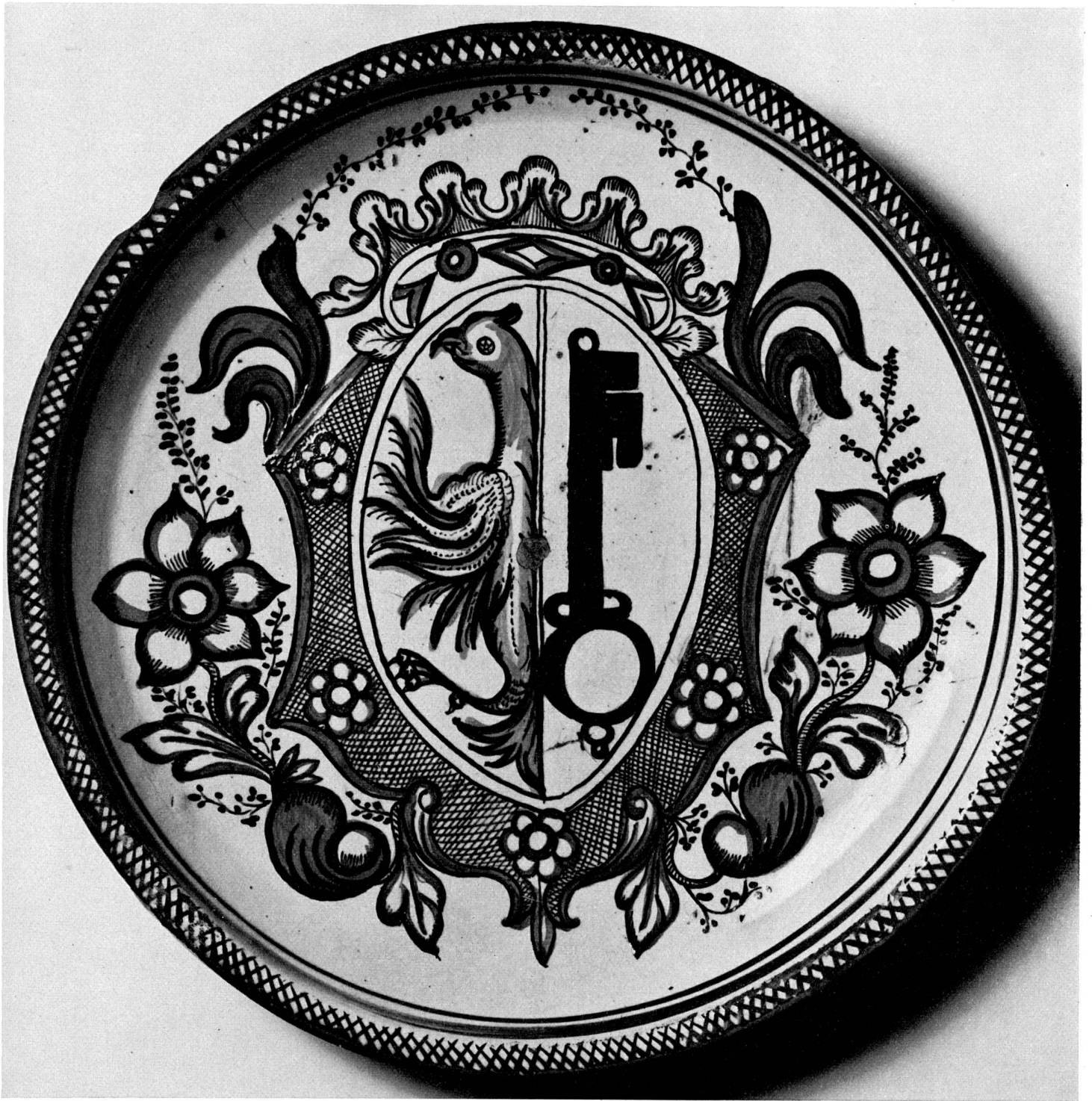
Abb. 7 Platte. Simmentaler Keramik. Um 1770 (S. 55)