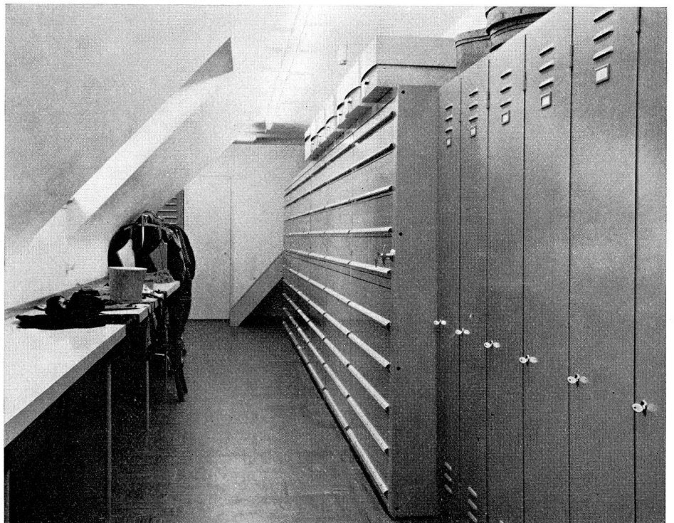
Abb. 9 Textilstudiensammlung, Abteilung Bekleidung (S. 21)