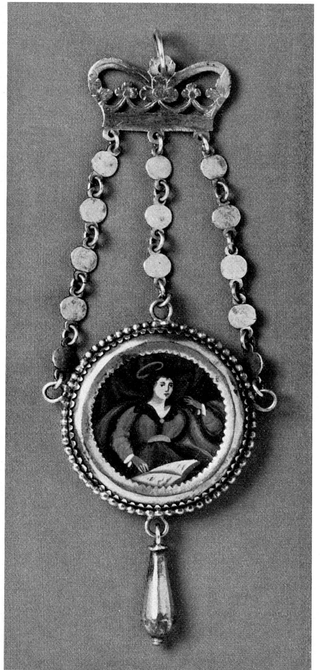
Abb. 12 Deli, Trachtenschmuck aus dem Kanton Solothurn. Anfang 19. Jh. (S. 56)