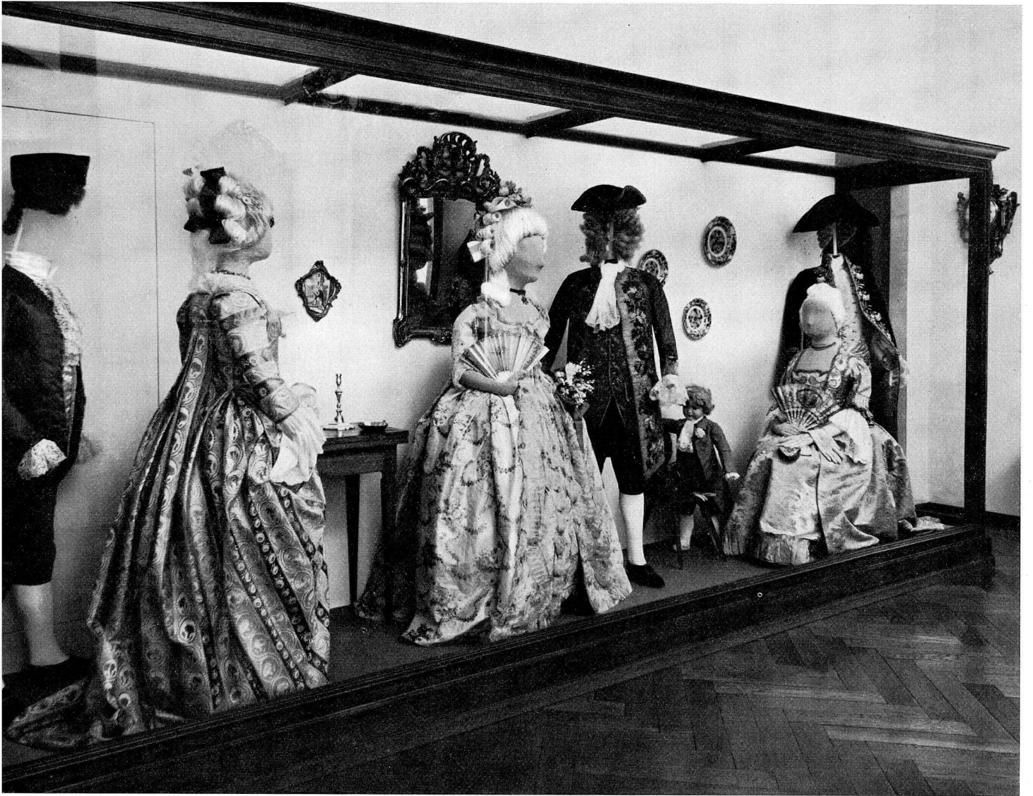
Abb. 10 Neugestaltete Kostümsammlung (S. 8)