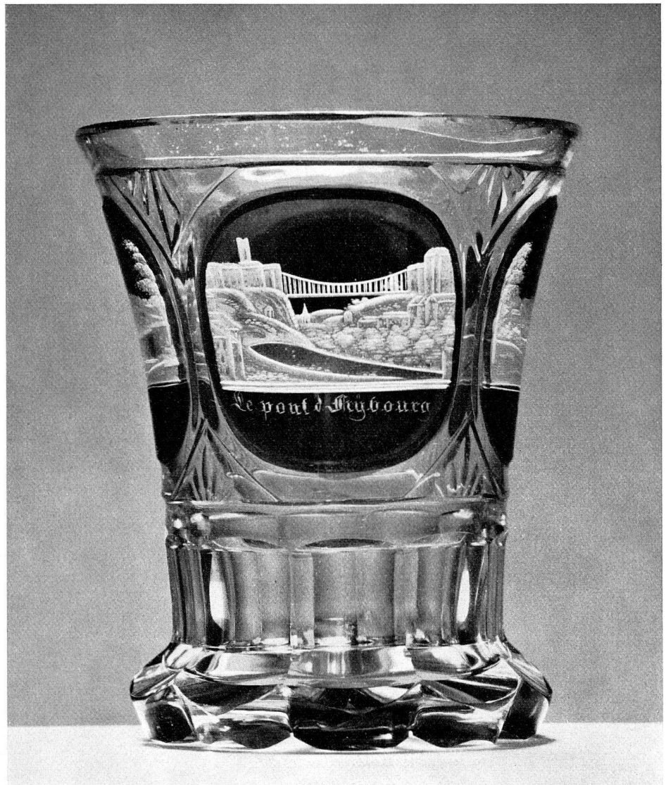
Abb. 20 Glasbecher mit Ansicht der Hängebrücke in Freiburg i. Ue. Nach 1834 (S. 53)

Kriegsschutz Es war im Berichtsjahr nicht möglich, in der Frage des Schutzes der Kulturgüter des Museums im Falle eines Krieges auch nur einen Schritt weiterzukommen. Es hat sich die Meinung durchgesetzt, dass entsprechend dem Charakter eventueller Kriegshandlungen abgestufte Schutzmöglichkeiten geschaffen werden sollten. Bei überfallartigen Geschehnissen wären wenigstens die grössten Kostbarkeiten in möglichst nahe gelegene, kleine und absolut sichere Schutzräume zu verbringen. Sofern mehr Zeit zur Verfügung steht, sollten grössere Teile des Museumsmaterials in dementsprechend grösseren Schutzräumen untergebracht werden. Aber auch in dieser Hinsicht stehen noch keine greifbaren Resultate in Aussicht.