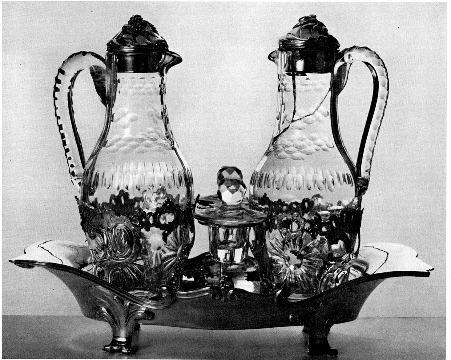
Abb. 21 Silbernes Huilier mit zwei Kristallflaschen, Arbeit von J. U. Fechter, Basel. Um 1750 (S. 53)