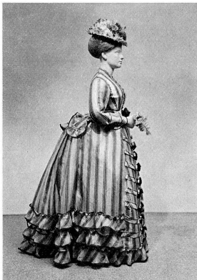
15. Neue Kostümfigur in Seidenkleid aus der Zeit kurz nach 1870

Die Instandstellung sämtlicher Studiensammlungsräume der urgeschichtlichen Abteilung ist auf Ende des vorangegangenen Jahres abgeschlossen worden. So konnte mit der Einordnung der Materialien in die Compactusanlagen fortgefahren werden. Sie erfolgte nach systematischen Gesichtspunkten, und Frau B. Rüttimann beendigte die Arbeit für die Epochen vom Neolithikum bis zur La Tènezeit. Die Funde aus der römischen und der frühmittelalterlichen Zeit wurden erst provisorisch untergebracht. Sie werden in einer weiteren Etappe verarbeitet werden. Ältere und neuere Bestände pflanzlicher Art, unter denen interessante steinzeitliche Sämereien vorherrschen, sind nun übersichtlich eingeordnet und damit für die Spezialisten erschlossen. Großformatige Objekte aus Stein und Ton, darunter eine große Zahl Bruchstücke von Architekturteilen, wurden in das Depot Bernerstraße ausgelagert und werden dort bei nächster Gelegenheit definitiv geordnet (Ressort Dr. R. Wyß).