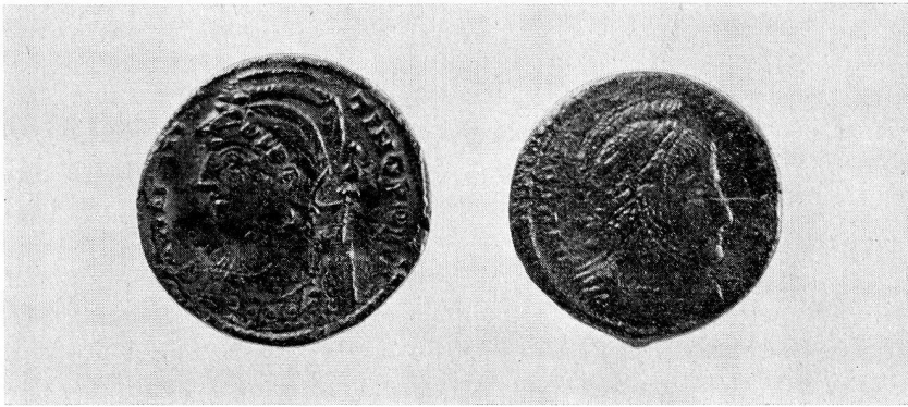
84. Ausgrabung in der Höhensiedlung Motta Vallac, Gemeinde Salouf (Kt. Graubünden). Silbermünzen mit dem Bild Konstantins aus dem Bereich des Festungsbaus. Doppelte nat. Größe (S. 32 und 75)