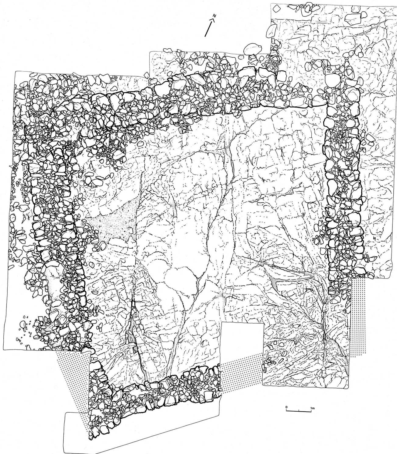
83. Ausgrabung in der Höhengiedlung Motta Vallac, Gemeinde Salouf (Kt. Graubünden). Grundriß eines Wehrturmes aus der Spätantike, mit mörtellos gefügtem Fundament und Holzaufbau (S. 44 und 73 ff.)

zusammengebrochenen Partien, in ihren Umrissen genau erfassen zu können. In einer weiteren Phase erfolgte die Ausräumung aller in sekundärer Lage befindlichen Kalksteinblöcke, wodurch sich die ganzen, in Trockenmauer-Technik gesetzten Fundamente des Festungsbaues klar abzeichnen begannen. Der Grundriß ist annähernd quadratisch. Die Innenmaße betragen etwa 10,5 m längs des nördlichen und westlichen Mauerzuges, während sie bei den beiden diesen gegenüber errichteten Fundamenten auf 9 m verkürzt sind (Plan Abb. 83). Der Verlauf wird durch die Gestalt der Felsrippe bestimmt, die im Westen teilweise eine