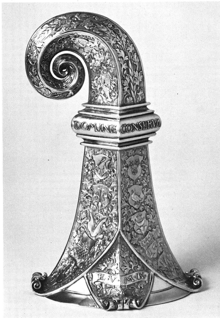
43. Vergoldetes Trinkspiel in Form eines Baselstabes, datiert 1916. Höhe 29,3 cm (S. 26)

In den Räumlichkeiten an der Binzstrasse 39 in Zürich (vgl. Jahresbericht 1975, S. 54) konnte die Uniformen-Studiensammlung mit eigenen Kräften zweckmässig und übersichtlich eingeräumt werden. Dabei verwendeten wir aus Spargründen ausschliesslich altes Einrichtungsmaterial. Obwohl der jährliche Zuwachs bedeutend ist – er betrug im Berichtsjahr 822 Nummern –, wird für die nächsten Jahre genügend Raum zur Verfügung stehen.