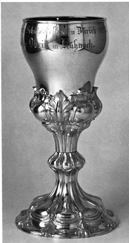
42. Silberner Schützenbecher, innen vergoldet, zum Eidg. Schützenfest in Zürich 1859. Höhe 20 cm (S. 26 und 61)