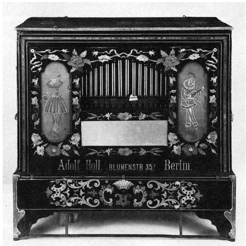
69. Walzendreorgel. Adolf Holl, Berlin. Um 1880–1900. Höhe 66 cm, Länge 75 cm. (S. 32, 68)

und insbesondere eine den Anforderungen der Praxis genügende Gliederung der konservatorischen Ressorts und der Verwaltungsdienste.