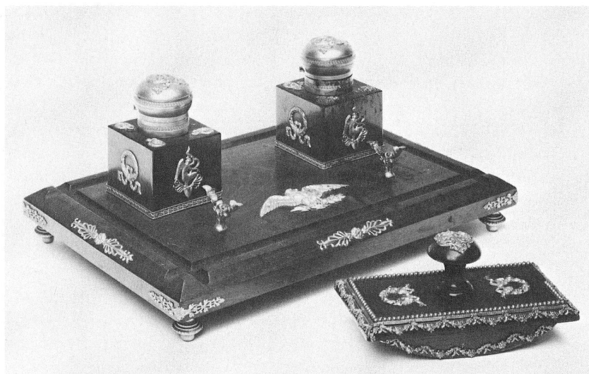
Abb. 95. Schreibzeuggarnitur. Wohl aus dem Besitz Generals Niklaus Franz von Bachmann in Näfels. Um 1810. Höhe 13,2 cm. (S. 28ff., 69)