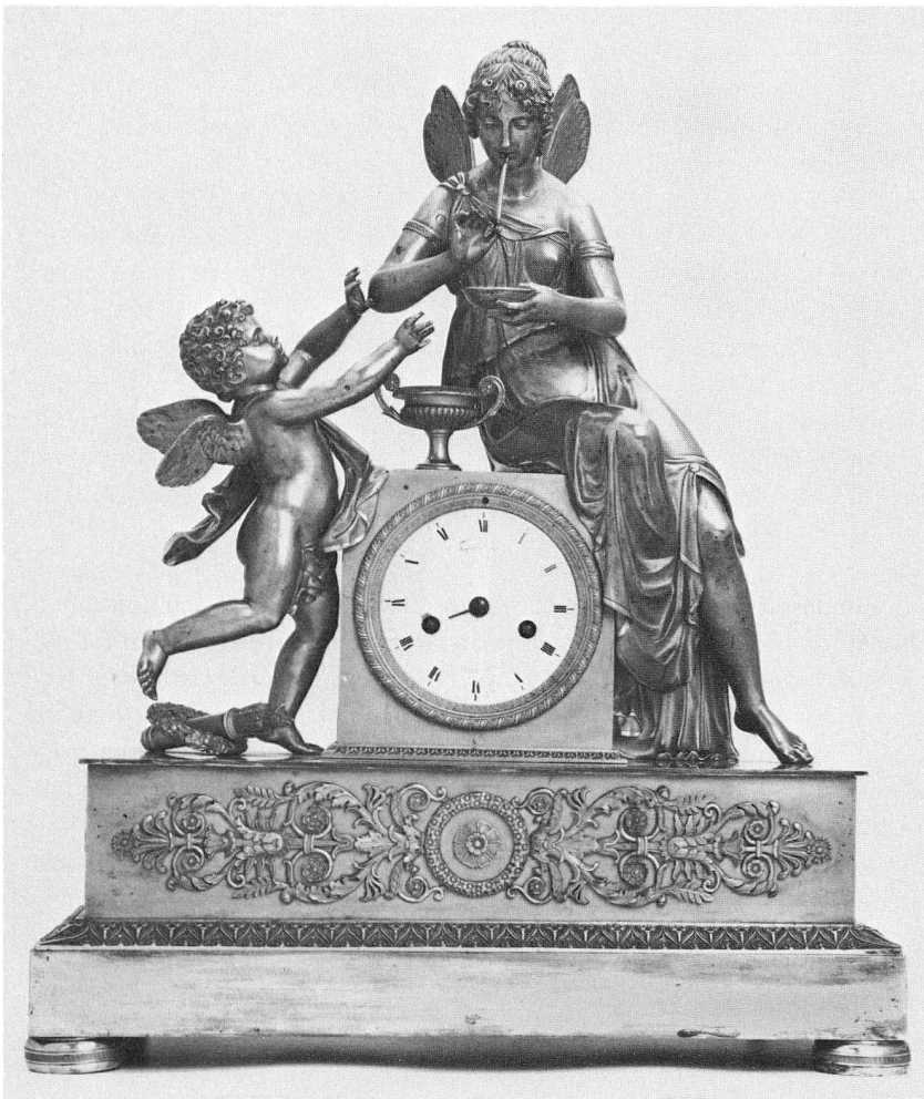
Abb. 94. Kaminuhr. Pariser Arbeit von Thomire. Wohl aus dem Besitz der Familie Hauser-Bachmann in Näfels. Um 1810. Höhe 50 cm. (Umschlag, S. 28ff., 69)

Wie jedes zivile Amt der allgemeinen Bundesverwaltung ist das Landesmuseum ins Projekt Effizienzsteigerung, kurz EFFI genannt, miteinbezogen und hatte aufgrund einer vom Bundesrat festgelegten Zielvorgabe unter Bezug des Ideenpotentials des eigenen Personals einen Katalog amtsbezogener Rationalisierungsmassnahmen zu erarbeiten. Verlangt sind personelle und finanzielle Einsparungen sowie ein Auffangen der bevorstehenden Arbeitszeitverkürzung ohne Stellenvermehrung. Rund dreissig betrieblich-organisatorische Massnahmen sind in unseren Diensten zwischen 1985 und 1987 zur Erfüllung der Vorgabe zu verwirklichen.