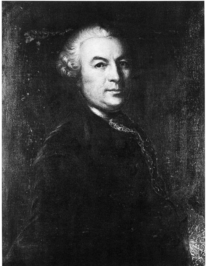
Abb. 63. Vermutlich Selbstbildnis von Johann Ludwig Aberli, 1723–1786, im Alter von 39 Jahren. 1762. Ölgemälde auf Leinwand. 80,5×63 cm. (S. 15, 32)

Paris F , Office National Suisse du Tourisme: «Zurich à Paris» Payerne , Musée de Payerne: «Le monde fascinant de la figurine historique» Pfäffikon , Heimatmuseum: «Mythos der Geschichte» St. Gallen , Stiftsarchiv im Regierungsgebäude: «Ulrich Rösch, St. Galler Fürstabt und Landesherr» La Sarraz , Schloss: «Aymon de Gingins» Schaffhausen , Museum zu Allerheiligen: «Kunst der Eiszeit» Schwyz , Ital-Reding-Haus, Ausstellung zum 100jährigen Bestehen der Feldmusik Schwyz Solothurn , Historisches Museum Schloss Blumenstein: «Kultur im Fels» La Tour-de-Peilz , Schloss, Eröffnungsausstellung im Musée suisse du jeu Weiningen , Schlössli: «Weiningen von 1450–1650, Chronik einer bewegten Zeit» Winterthur , Technorama: «Medizinal-Technik» Winterthur , Kunstmuseum: «Johann Rudolf Schellenberg – Observator Naturae» Würzburg D , Festung Marienberg, Ausstellung zum 700. Todestag Konrads von Würzburg Zürich , Haus «Zum Kiel»: «Momente des Glücks» Zürich , Haus «Zum Rech»: «Von der Schissgruob zur Stadtentwässerung»