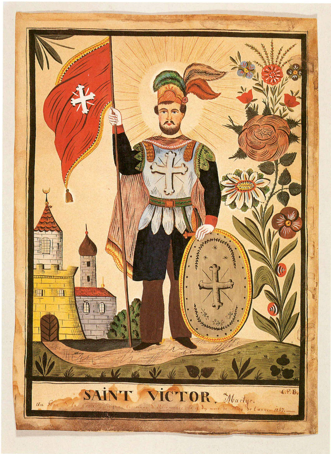
Gouache. SAINT VICTOR, Martyr. Charles-Frédéric Brun (Le Déserteur). 1857. 29 × 20,8 cm.