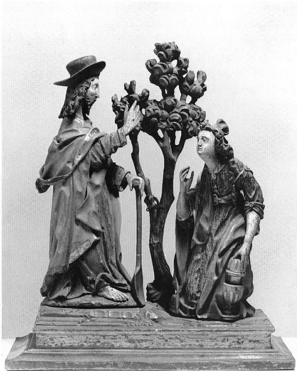
Abb. 69. Noli me tangere, Christus als Gärtner mit Maria Magdalena. 17. Jh. Höhe 27 cm.

Geburt Christi aus Flums nach dem Schongauerstich B. 56 für die grosse Schongauer-Ausstellung in Colmar. Für ihre Präsentation im «Blickpunkt» erfuhr die «Noli me tangere-Gruppe» aus dem Frauenkloster St. Andreas in Sarnen die notwendige Auffrischung (Abb. 69). Die Restaurierung der sogenannten Muttergottes aus Büren, deren Entstehungszeit im 14. Jahrhundert dank Altersbestimmung nach der C-14-Methode bestätigt werden konnte, steht vor dem Abschluss. Eine grundsätzliche Untersuchung, die noch einige Zeit beanspruchen wird, drängt sich auch für das Vesperbild aus Graubünden auf. Von der Restaurierung der Kassetten aus Attinghausen handelt der Bericht der Sektion Kulturgeschichte II (vgl. S. 78 ff.).