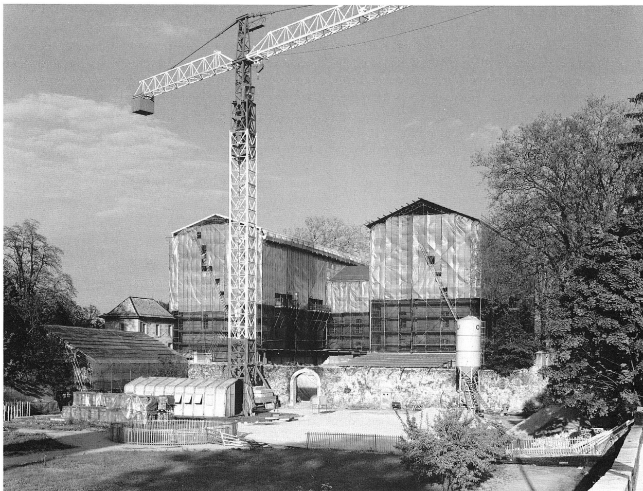
Fig. 10. Pas une œuvre de Christo, mais le Château de Prangins.

Le groupe d'experts-historiens qui assiste les conservateurs dans la définition de la thématique d'exposition