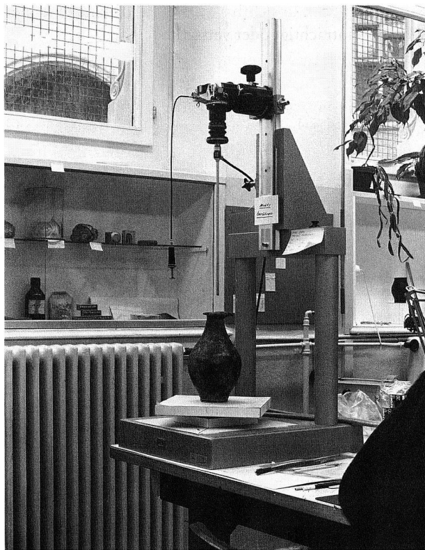
Abb. 1. Das auf eine Kleinbildkamera montierte Endoskop.

Im Winter 1992/93 wurden im Labor der Sektion Kulturgeschichte I die Restaurierungsarbeiten am Hortfund aus dem römischen Gutshof in Neftenbach ZH abgeschlossen. Dieser wurde am 16. Dezember 1986 im Rahmen einer Notgrabung der Kantonsarchäologie Zürich in einem Gebäude neben einem seitlichen Eingangstor zur «pars rustica» geborgen. Dort war die mit Münzen gefüllte Bronzekanne unter einem Bretterboden versteckt worden. Insgesamt befanden sich im Gefäss 1239 Antoniniane und vier Denare der Kaiser Septimius Severus bis Postumus. Die wissenschaftliche Bedeutung des kurz nach 265 n. Chr. vergrabenen Hortes liegt einerseits in der Geschlossenheit des Fundes, andererseits in den gün-