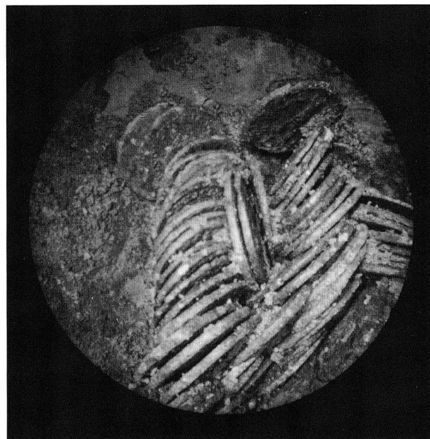
Abb. 2. Blick ins Gefäss mit Aufsicht auf zwei Münzrollen.

stigen Fundumständen und in den dadurch zu gewinnenden historischen Aussagen. Über dem Bretterboden lag eine Zerstörungsschicht, die besonders aufgrund numismatischer Zeugnisse frühestens in die 80er Jahre des 3. Jh. n. Chr. datiert werden kann. Die «Bedrohung», die zum Verstecken der Barschaft geführt hatte, war somit nicht dieselbe, die den Niedergang des Gebäudes nach sich zog.