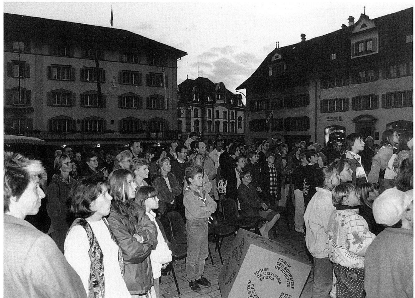
Abb. 1 Eröffnung des Forums der Schweizer Geschichte in Schwyz, Festakt auf dem Dorfplatz.

Vertreterinnen und Vertretern aus Politik, Wirtschaft, Wissenschaft, Kultur und zahlreichen Zuhörern aus der ganzen Schweiz. Am Eröffnungswochenende überzeugten sich gut 5'000 Besucherinnen und Besucher von den Vorzügen dieses modernen Museums und «Forums» für verschiedenste Aktivitäten, aber auch von der Freude der Einheimischen, die in den Festwirtschaften auf Plätzen und in Höfen des Zentrums von Schwyz ihren Stolz über ihre neueste Kulturstätte zeigten. Dem spontan guten Echo aus der engeren Region folgte später auch die breite Zustimmung aus den übrigen Landesteilen,