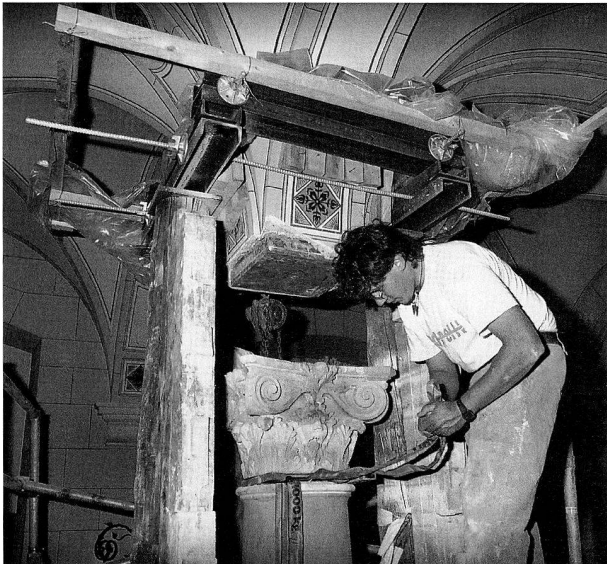
Abb. 4 Ausbau eines Kapitells in der Eingangshalle des Museums.

Peter Werhahn. Die Sammlung Werhahn umfasst 140 Münzen aus dem gesamten keltischen Raum. Das Ausstellungskonzept sah vor, eine geographisch geordnete Übersicht der keltischen Münzprägung zu präsentieren. Damit konnte die gesamte Werhahnsche Sammlung, ergänzt durch zahlreiche Prägungen aus der bedeutenden Sammlung keltischer Münzen des Münzkabinetts, ausgestellt werden. Angesichts der Vielfalt und Originalität der keltischen Münzen wurde bewusst eine sachliche und übersichtliche Gestaltung der Ausstellung angestrebt.