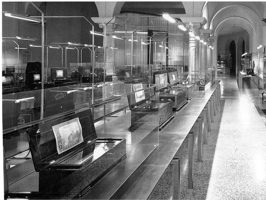
Abb. 1 Ausstellung «KlangKunst – 200 Jahre Musikdosen».

verschiedene öffentliche Demonstrationen durchzuführen, so vom 2. bis 5. Mai anlässlich des Internationalen Bronzgießer-Workshops in Halle an der Saale, am 19. Juni in Unteruhldingen am Bodensee, am 19. Juli in Wildegg für eine Equipe des Bayerischen Fernsehens, am 27. und 28. Juli im Archéodrome von Beaune bei der jährlichen Table ronde der Bronzgießer und Kupferverhütter, am 1. Oktober in Wildegg für den Südwestfunk 3, am 3. November im Rahmen eines Blockkurses über Archäometallurgie für StudentInnen der Universitäten Bern, Neuenburg und Freiburg und schliesslich am 7. Dezember für StudentInnen der Universität Basel.