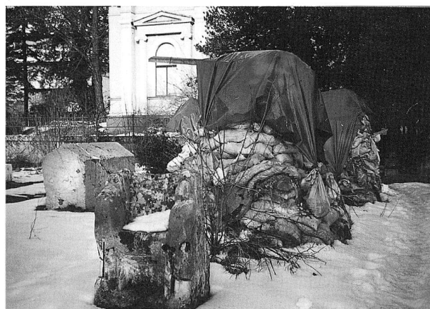
Abb. 3 Garten des Zemaljski Muzej in Sarajevo. Die Sandsäcke schützen archäologische Funde.