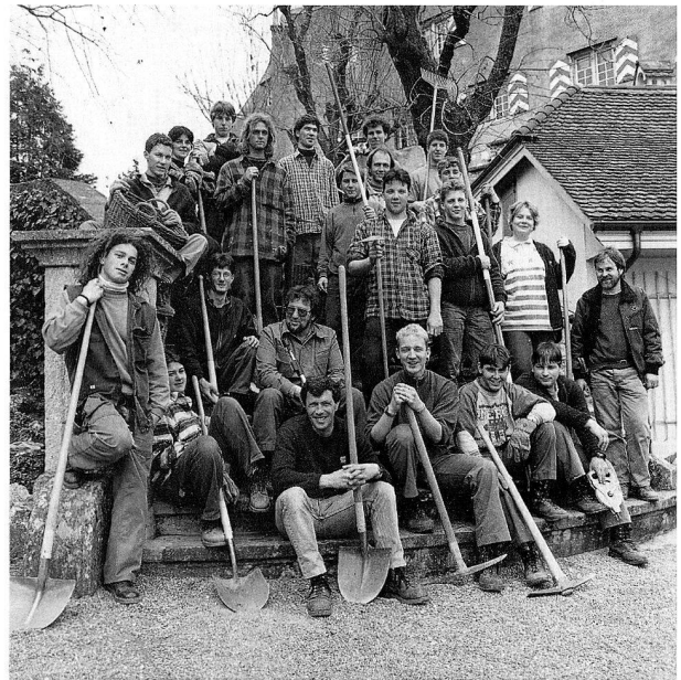
Abb. 6 Gruppenbild der auf Wildegg arbeitenden Landschaftsgärtnerinnen und Landschaftsgärtner.