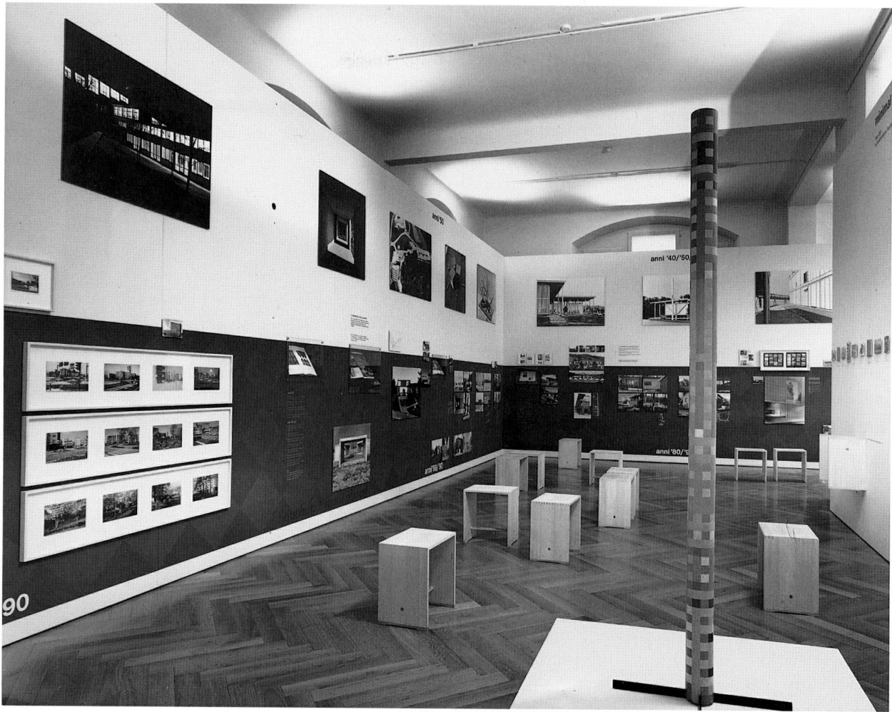
Abb. 5 Ausstellung «minimal tradition – Max Bill und die «einfache Architektur» 1942–1996».

frühen Kachelöfen gezeigt, und schliesslich konnten auch einige Skulpturen aus dem Depot neu in die Dauerausstellung integriert werden.