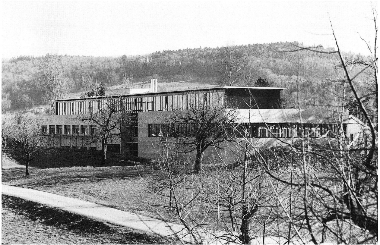
Abb. 7 Neubau des Musikautomaten Museums in Seewen zur Zeit der Aufrichte.