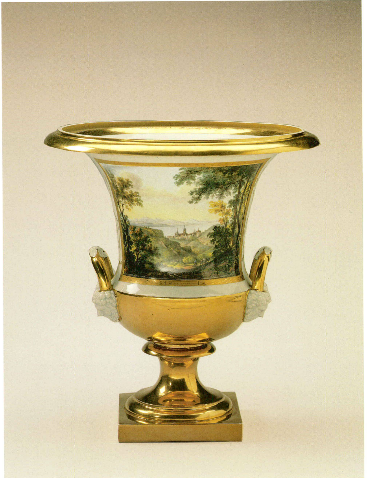
Ziervase. Porzellan. Ansicht von Lausanne. Porzellanmanufaktur Nymphenburg. Um 1825. Höhe 33,5 cm.