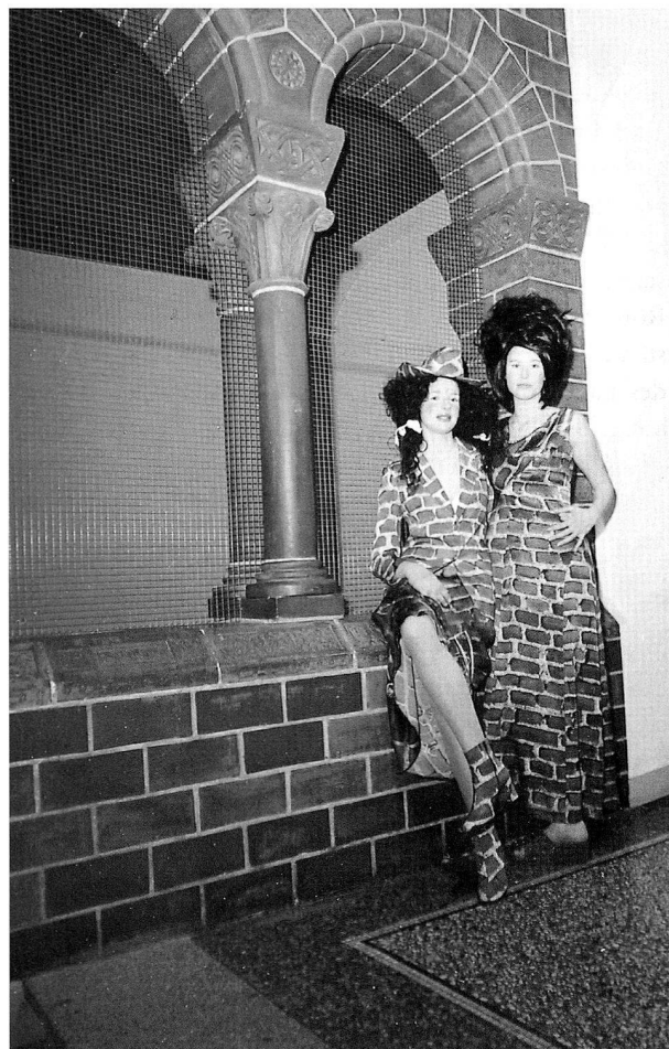
Abb. 1 «Parcours de la mode» des Modehauses Grieder, Zürich.

In Zürich lagen die Ausstellungsschwergewichte im zweiten und letzten Viertel des Jahres: «Modedesign Schweiz 1972–1997» zeigte erstmals in unserem Land das kreative Schaffen der einheimischen Modedesignerinnen und -designer der letzten 25 Jahre. Damit konnten auch die Bemühungen um vermehrte Berücksichtigung der Alltagskultur und gestalterischer Produkte des 20. Jahrhunderts der Öffentlichkeit nahegebracht werden. In verschiedenen Rahmenveranstaltungen kamen Kennerinnen und Kenner der aktuellen Modeszene zu Wort, und eine Filmreihe im Kino Xenix ergänzte das Programm. «Tout Zürich» folgte einem «Parcours de la mode», bei dem sich über hundert Models, eingekleidet in die Frühjahrs- und Sommerkollektionen von Grieder les Boutiques, in den historischen Räumen des Museums in einer aussergewöhnlichen Choreographie präsentierten (Abb.1). Weitere Events, «Soirée en soie» mit Kreationen von Andy Stutz und «Ethno Collections» von