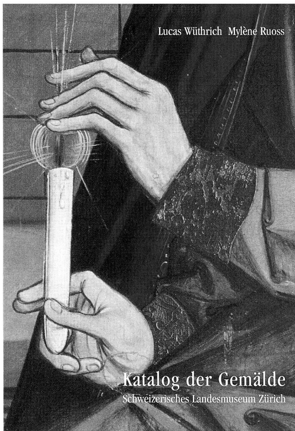
Abb. 2 Der 1997 erschienene Katalog der Gemäldesammlung.

Zusammen mit der Ausstellung «Die Alamannen» konnte auch der Katalog mit Hintergrundinformationen und neuesten Forschungsergebnissen zu den verschiedensten Themen übernommen werden. Die von Spezialisten für ein Laienpublikum geschriebenen Texte lassen ein anschauliches Bild des frühmittelalterlichen Lebens entstehen.