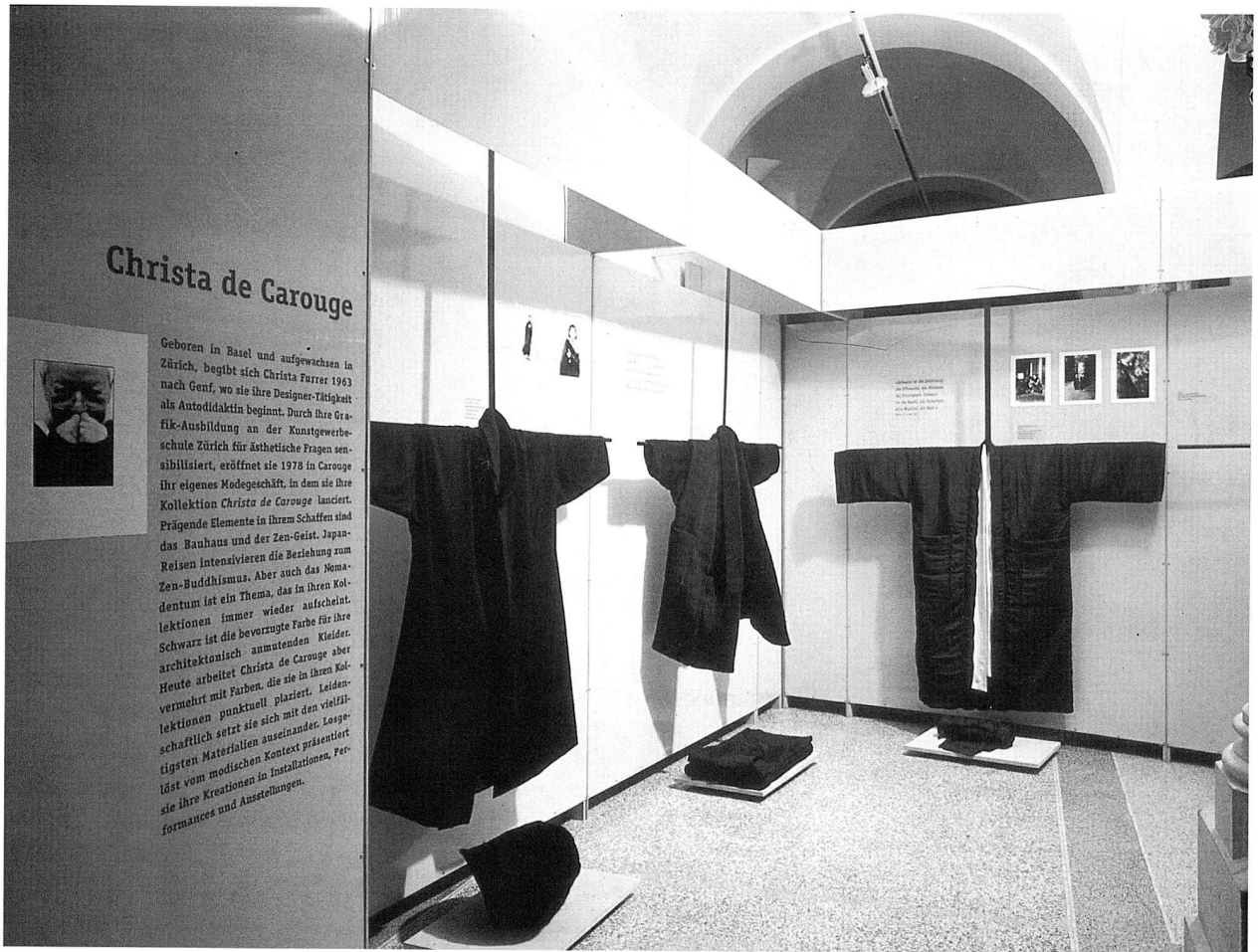
Abb. 3 Ausstellung «Modedesign Schweiz 1972–1997». Bereich Christa de Carouge.

chen «Parcours de la mode», der durch die Räumlichkeiten des Landesmuseums führte und mittels Inszenierungen den Besucherinnen und Besuchern die neuesten modischen Kreationen vorführte (Abb. 1). Andi Stutz verwandelte die Eingangshalle des Museums mit seinen wunderschönen Fabric Frontline-Stoffen in einen Märchenraum. Den Abschluss der Ausstellung bildete ein Modefest, das im Hof des Landesmuseums stattfand und ca. 1200 Personen anlockte. Die Modefachklassen der Schulen für Gestaltung Basel und Zürich zeigten eine Modeschau von erster Güte, die mit aller Kraft offenbarte, dass das kreative Potential im modischen Bereich auch in Zukunft gesichert sein wird. Ausstellung und Rahmenveranstaltungen kamen dank grosszügiger Unterstützung der Bank J. Vontobel & Co AG, Zürich, zustande.