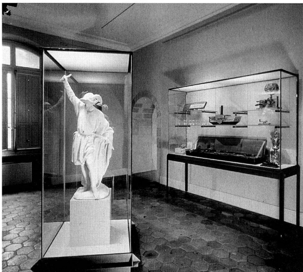
fig. 9 Château de Prangins, vue de l'exposition.

Le 19 juin, le musée a reçu les écoles (fig. 10). Les élèves de Prangins et alentours ainsi qu'une classe de Kilchberg (canton de Zurich) ont pu découvrir le musée et son parc. A la fin de l'après-midi, une réception a eu lieu pour les membres de l'Association des Amis du Château de Prangins.