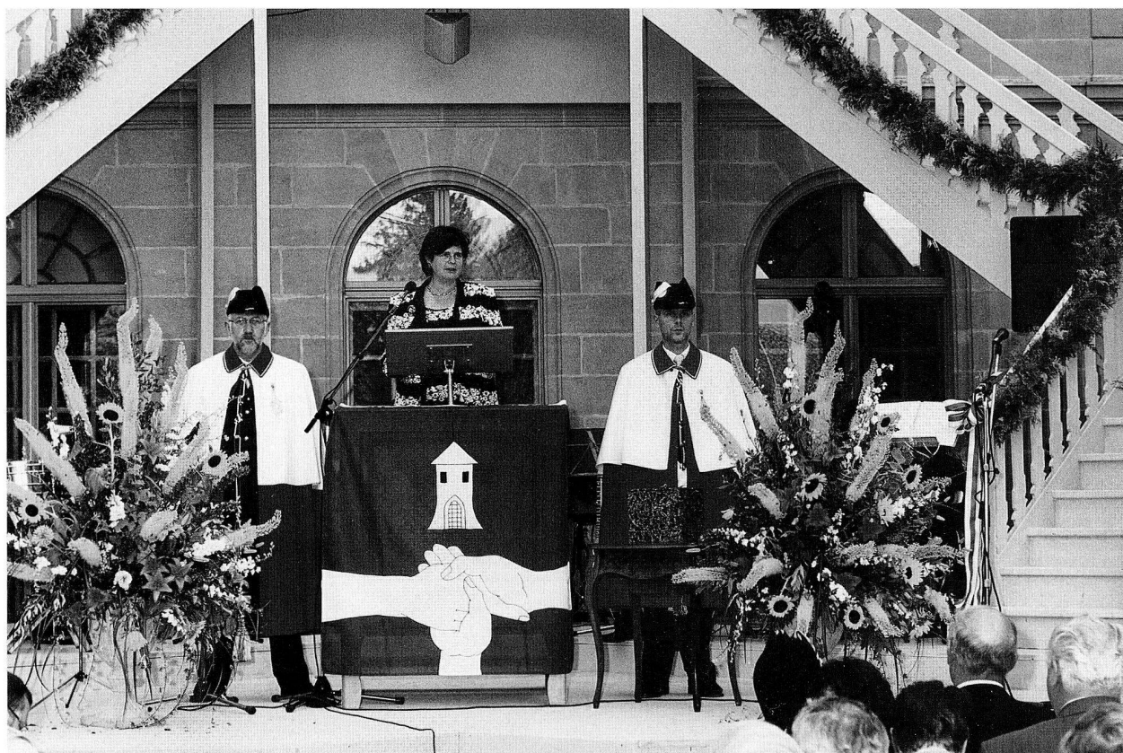
fig. 8 Ouverture du Château de Prangins par la conseillère fédérale Mme Ruth Dreifuss.