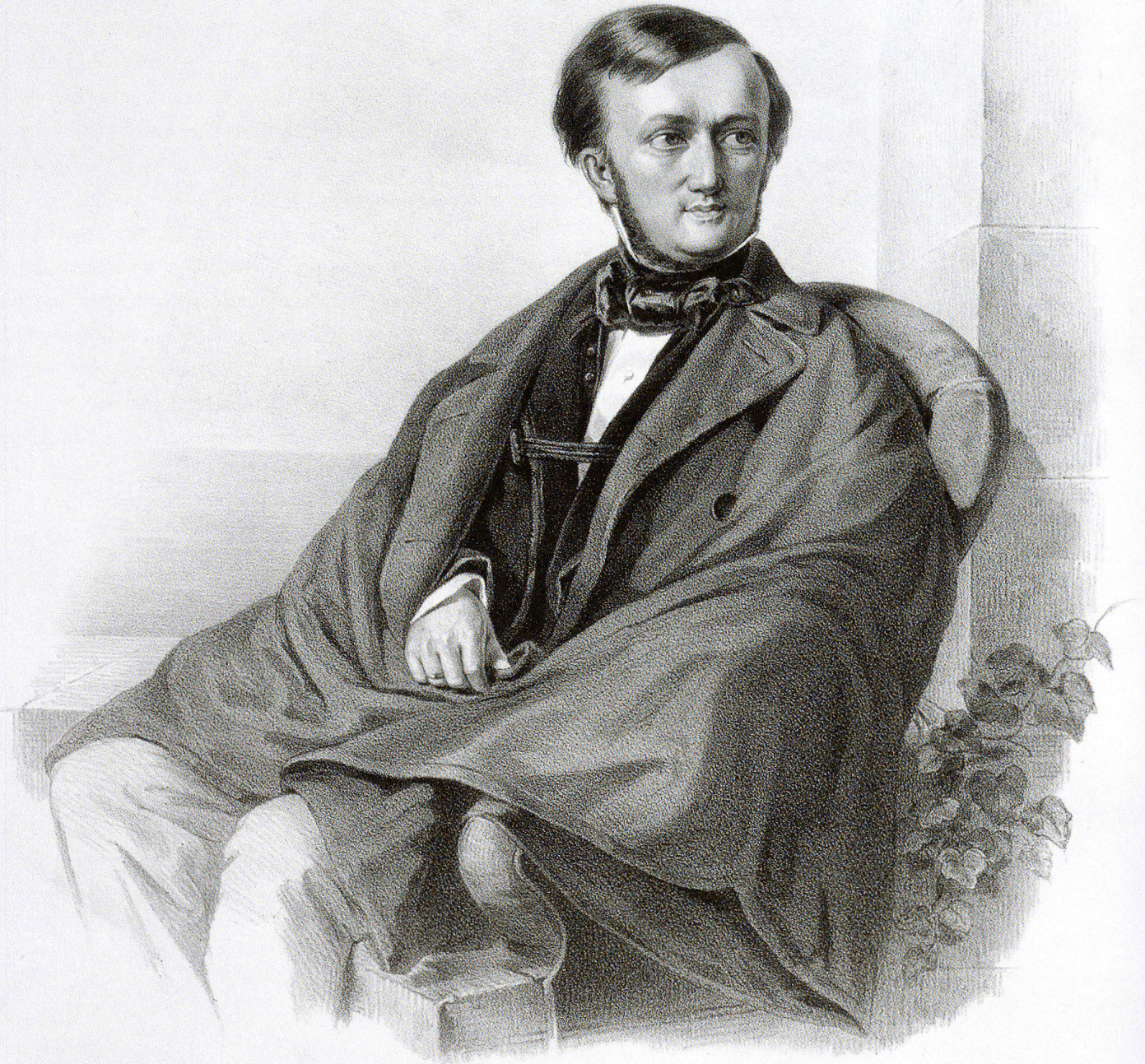
Lithu gedr. bei Fr. Hofstaengl in Dresden.