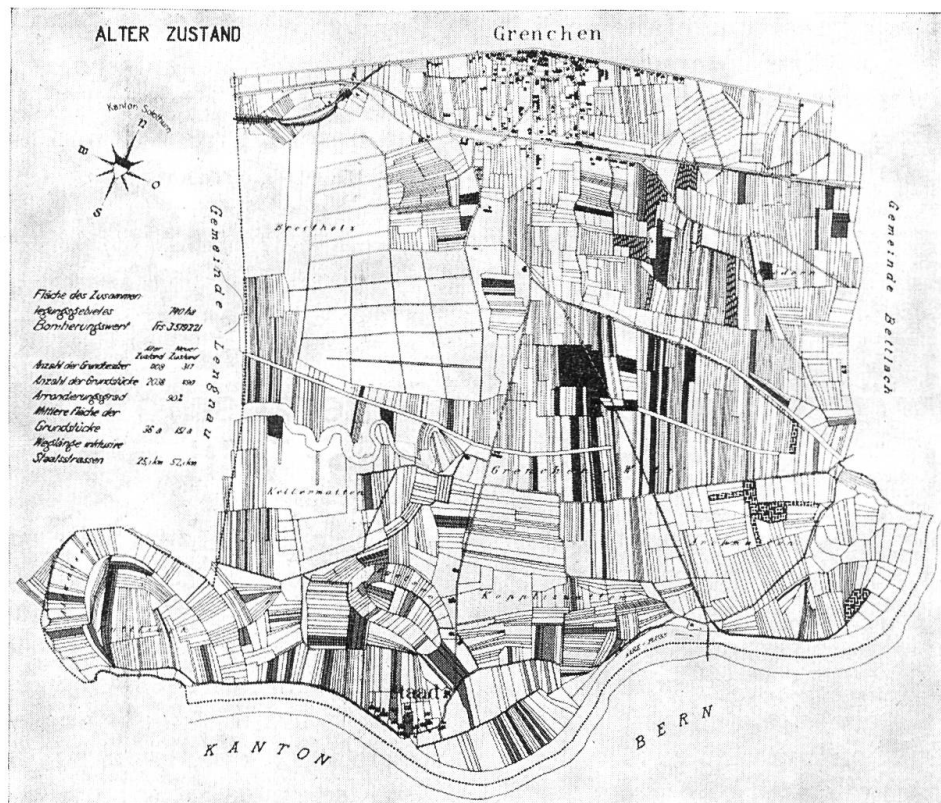
Güterzusammenlegung in Grenchen : Alter Zustand

lichkeiten führte. Durch die übermäßige Parzellierung war bis ein Viertel der Landfläche als Grenzgräben un- bebautes Land. Die 2038 Grundstücke im alten Zustand konnten durch die Parzellierung auf 490 reduziert werden und die Durchschnittsfläche eines jeden Stückes erhöhte sich von 36 Aren auf 151 Aren. Hiezu war ein Kosten-