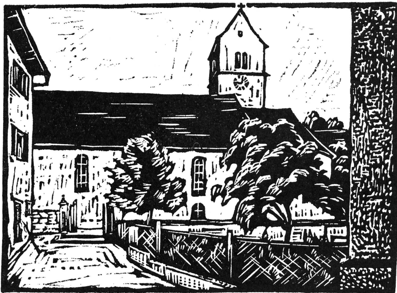
Die Kirche von Büren

und andere Zuhörer von Büren, Seewen, Hochwald, Gempen, Nuglar und St. Pantaleon erschienen, sonnengebräunte, wetterfeste Gestalten, denen die harte Arbeit auf der Heimatscholle im Gesicht geschrieben stand. Sie hörten dem Unterrichte aufmerksam zu, blätterten in den aufgelegten Schulheften und im «Programm», lobten dies, tadelten jenes und schenkten wohl auch