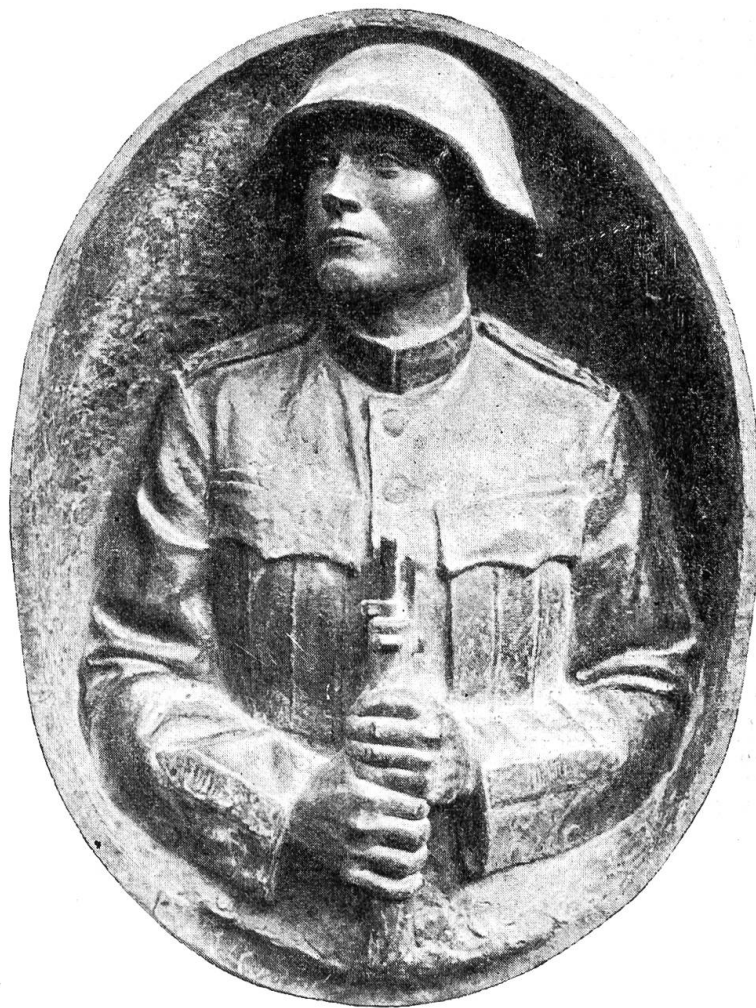
v. Bildhauer Rudolf