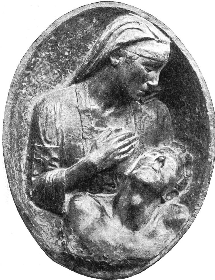
v. Bildhauer Rudolf